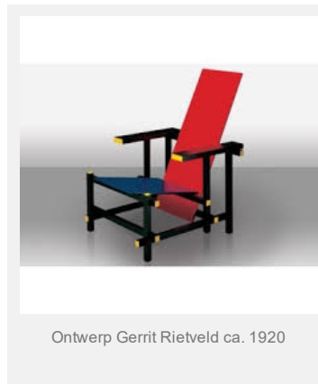
Ontwerp Gerrit Rietveld ca. 1920

Niet alleen kwetsbare groepen hebben last van houtstook, eigenlijk iedereen. Dat voelt je dat niet direct, maar pas na verloop van tijd. Houtrook is volgens medische onderzoekers