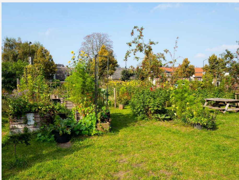
Allegro Tuin nog in herfststooi in oktober 2017

snoreisten opgeruimd. De vernielde omheining is hersteld, het graspad geëffend, het onkruid gewied en grasranden werden afgestoken. Helaas moest ook hondenpoep worden opgeruimd, terwijl er nota bene een apart hondenveld is en daar zakjes hangen om de eigen 'productie' op te ruimen. Elke donderdagochtend wordt er weer aan de tuin gewerkt. Er is genoeg te doen: verven, zaaien, compost verspreiden, wieden en maaien. Ook meedoen? Graag! Stuur een berichtje naar beterzeist@gmail.com of naar Hanna van den Dool: 06 460 826 57.