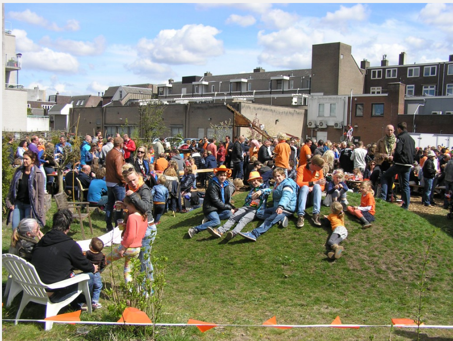
Koningsdag 2015 Allegro Tuin Zeist: kinderen op de heuvel