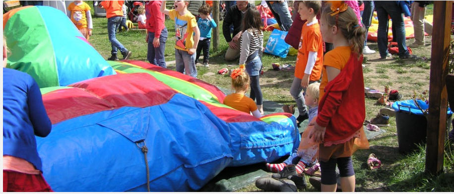
Koningsdag 2015 Allegro Tuin 2015: kinderspeelplek