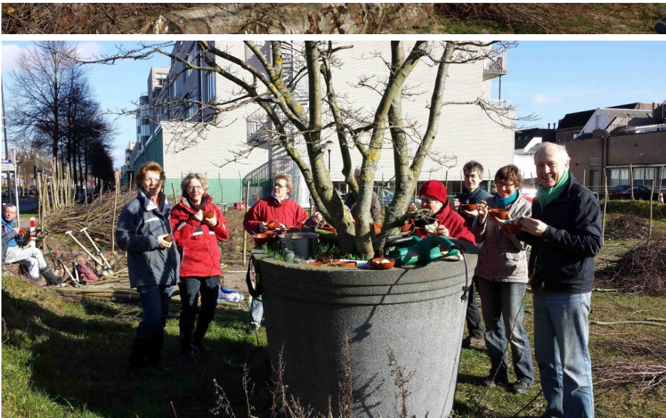
Na het harde werken smaakt de tomatensoep dubbel zo lekker. En laat de zon ook nog meerwerken! Enkele vrijwilligers kijken op koningsdag vergenoegd naar de resultaten van hun inspanningen