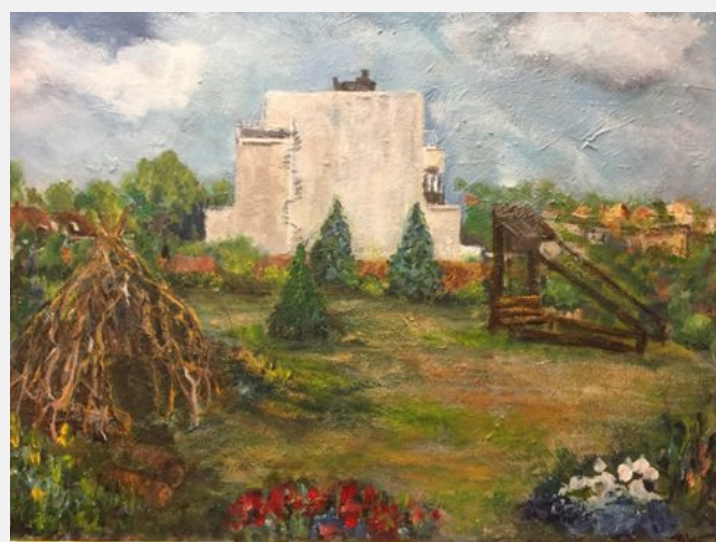
Allegro Tuin twee maal geschilderd door Bibet Buurman in 2019