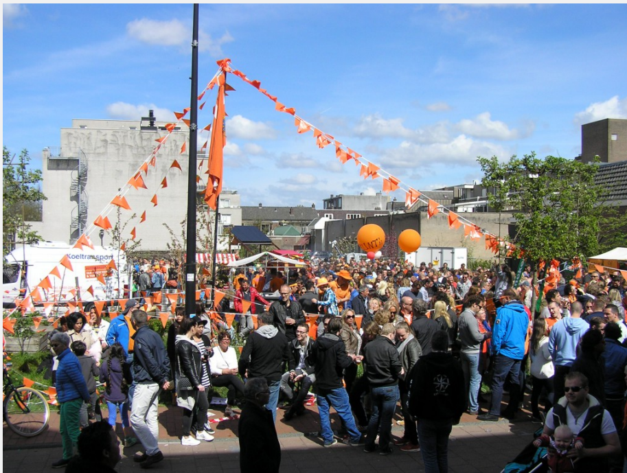
Allegro Tuin Zeist: Koningsdag 2015

Was de Koningsdag 2014 al een groot succes, de tweede in 2015 was zo mogelijk nog drukker met prachtig zonnig weer voor jong en oud.