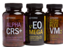
Lifelong Vitality Vegan Pack™