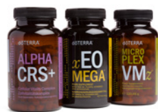
Lifelong Vitality Pack™