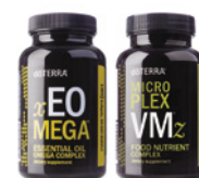
Daily Nutrient Pack™