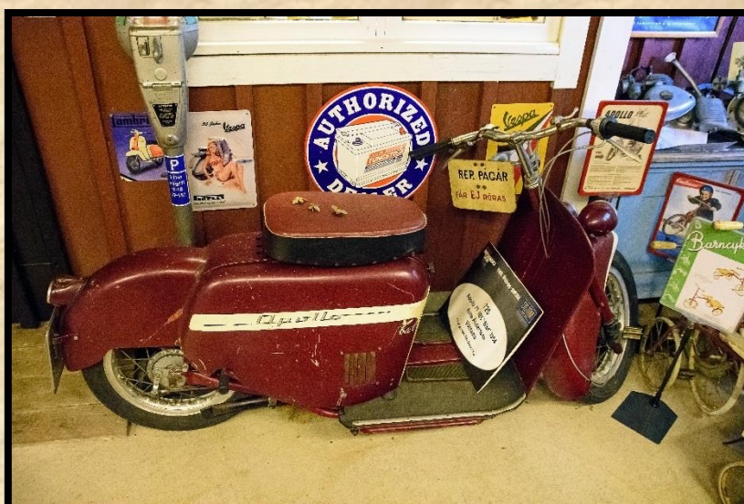
Apollo 77 JBS Biet 1954.