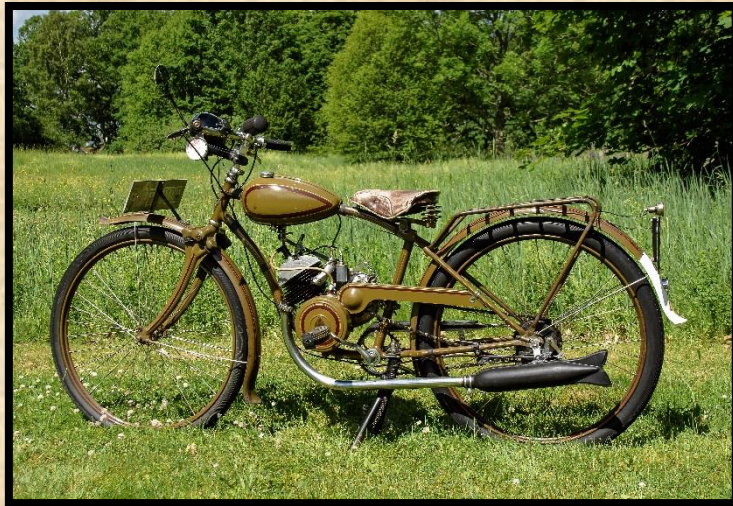
Apollo lättviktare 98 cc.