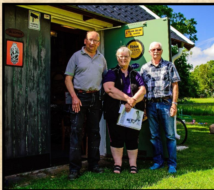
Tusen Tack! För ett trevligt besök med mycket kunnig guidning bland Apollos alla historiska föremål.