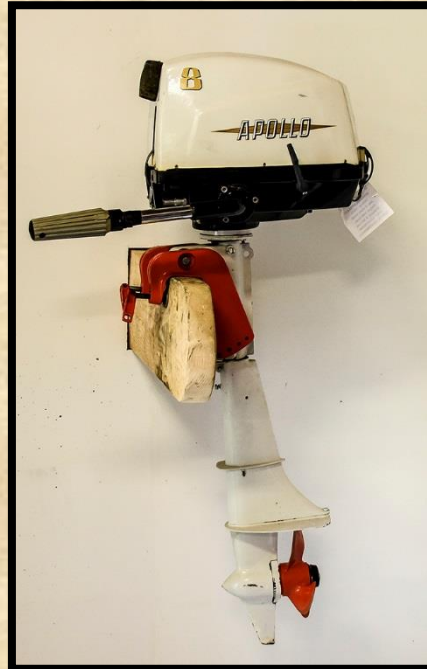
Apollo Marin 8.

Cylinderantal: 2 Cylinderdiam.: 45 mm Slaglängd: 44 mm