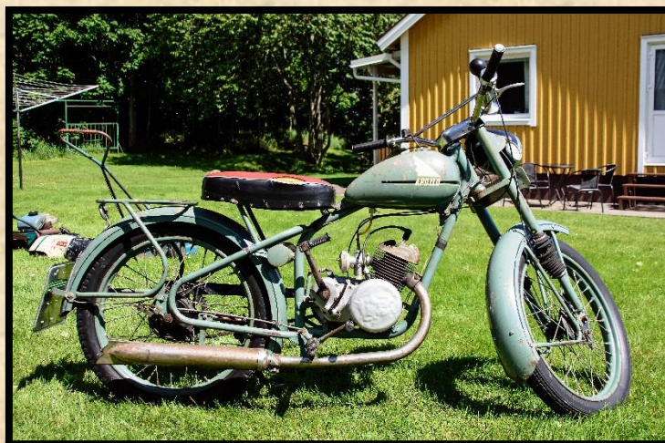
Apollo "Ekonom" 1957.