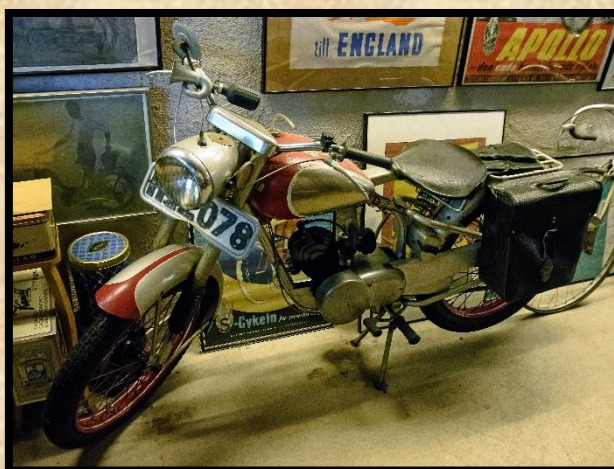
Apollo 69 årsmodell 1953.