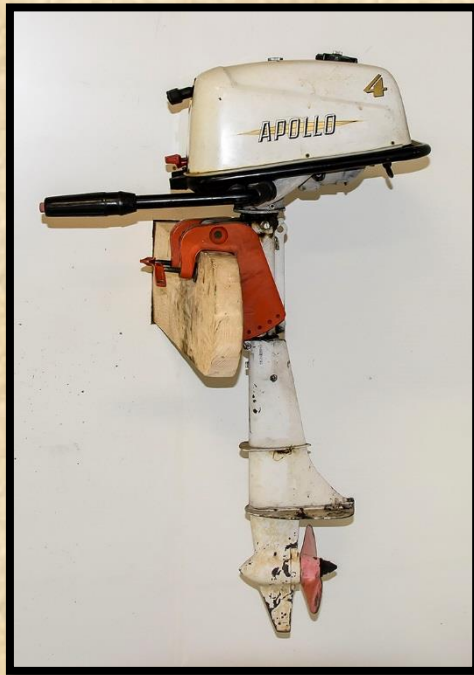
Apollo Marin 4. Bildkälla ur Bertil Sporrongs samling.