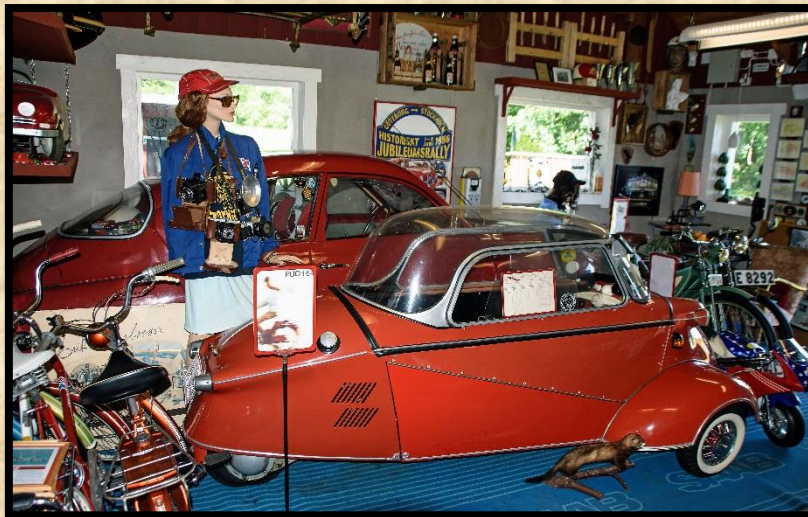
Messerschmitt KR 200 årsmodell 1958.