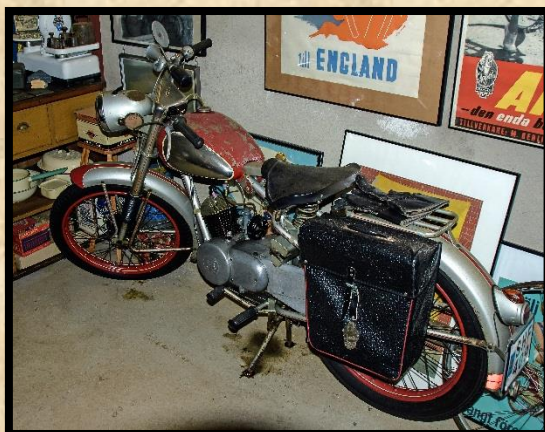
Apollo 69 årsmodell 1953