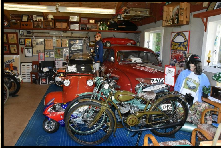
Interiör från samlingen, Messerschmitt 1958 och Saab 96 sport 1964.