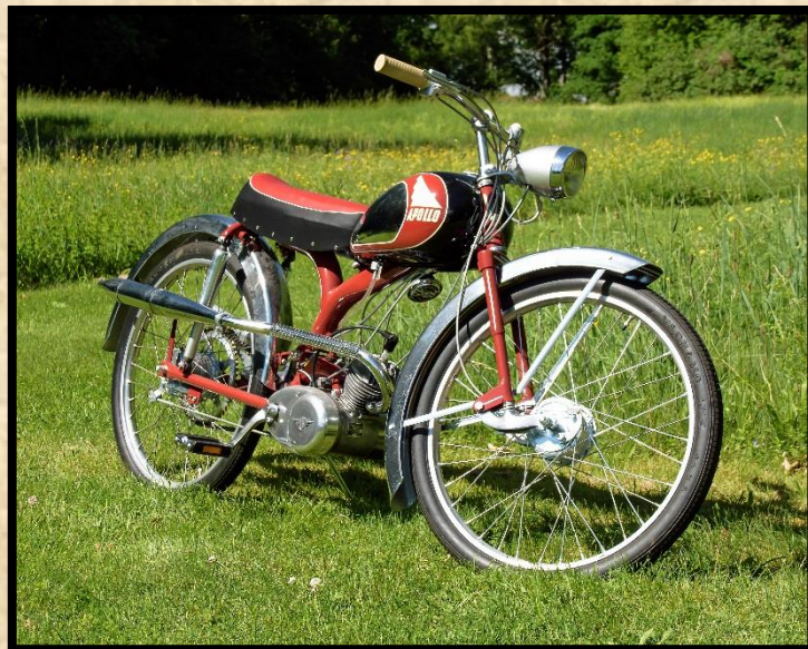
Apollo Z9 Competition (stag saknas).