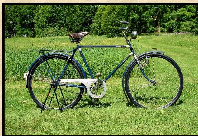
Apollo cykel lågprismodell Simson 1940.