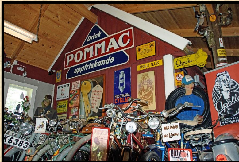
Interiörbild från samlingen.