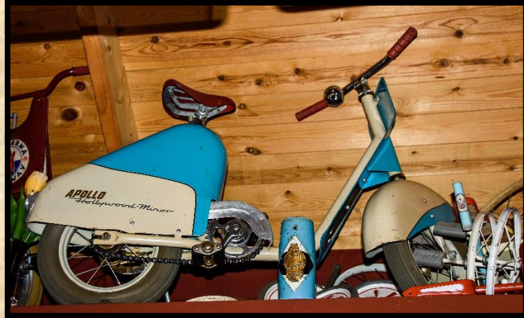
Apollo Hollywood minor.