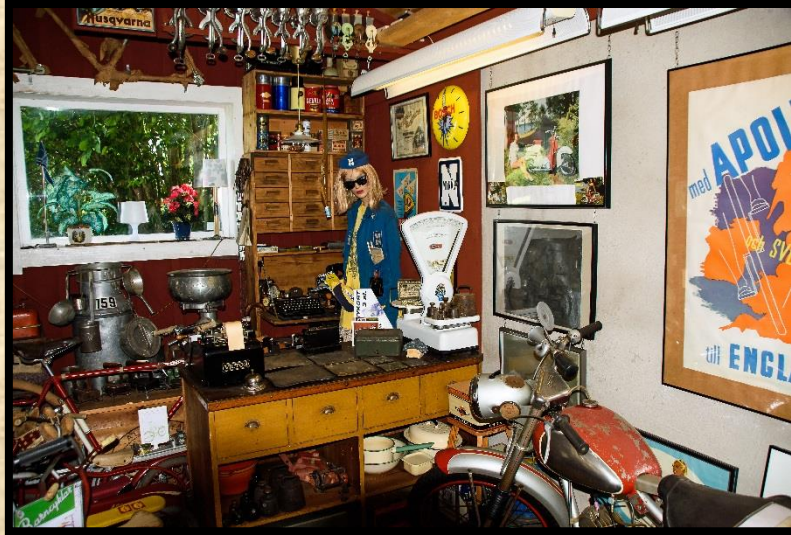
Interiörbild från samlingen.