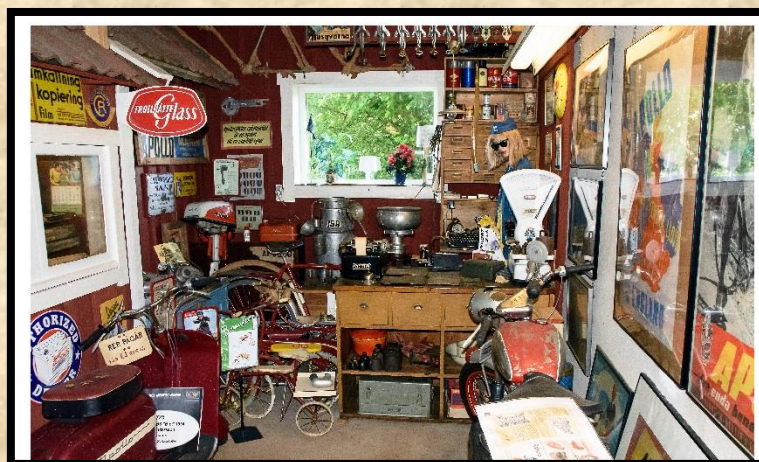
Interiörbild från samlingen.