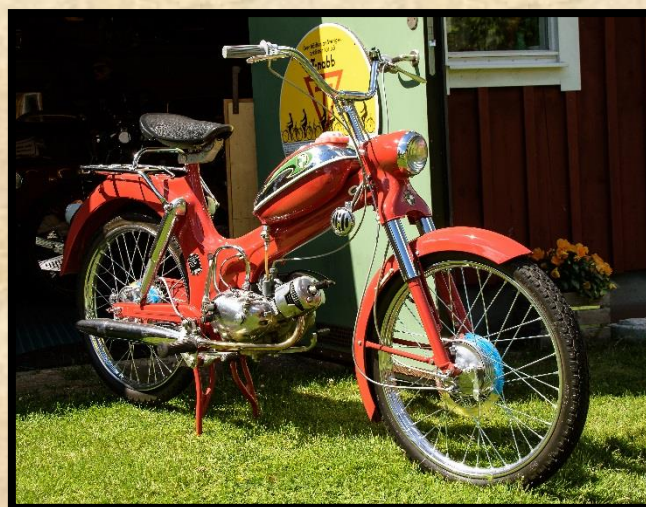
Puch Florida 1455 årsmodell 1964.