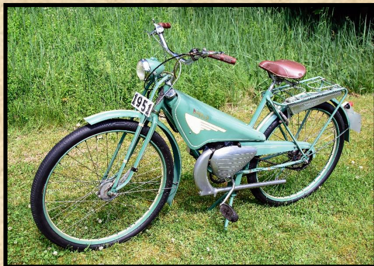
Apollo Motorette 60L 1951.