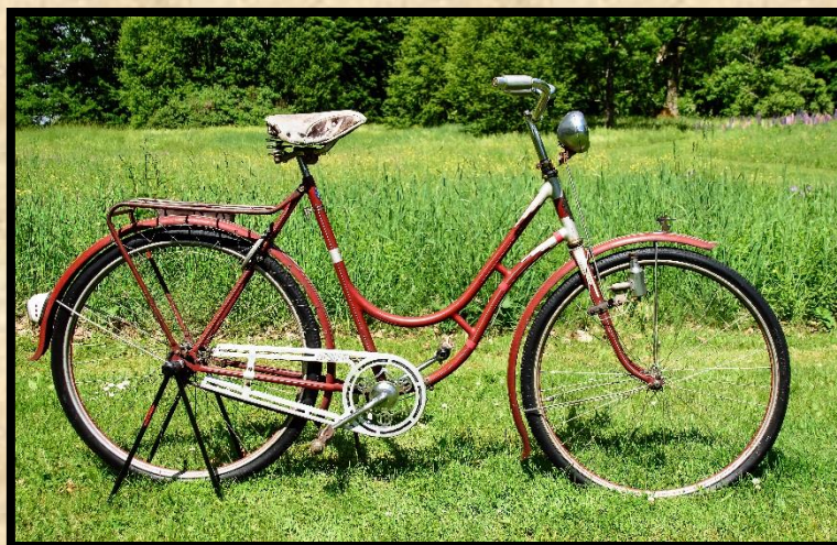
Apollo damcykel 1940.