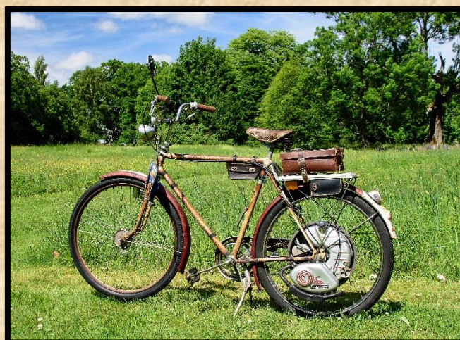
Apollo sport herrcykel 1957 med cykelmaster 1953.