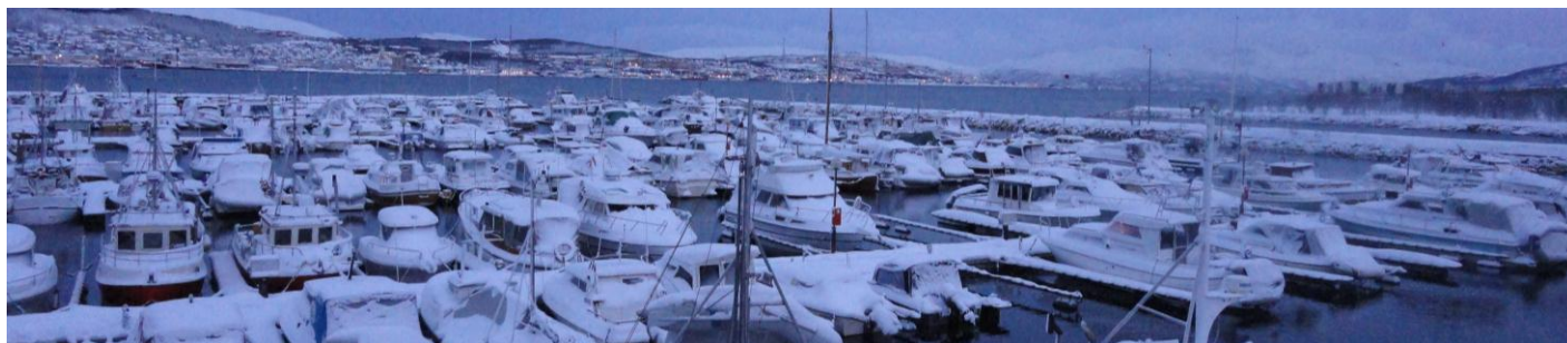
Desember i havna i Tromsdalen, Tromsø.