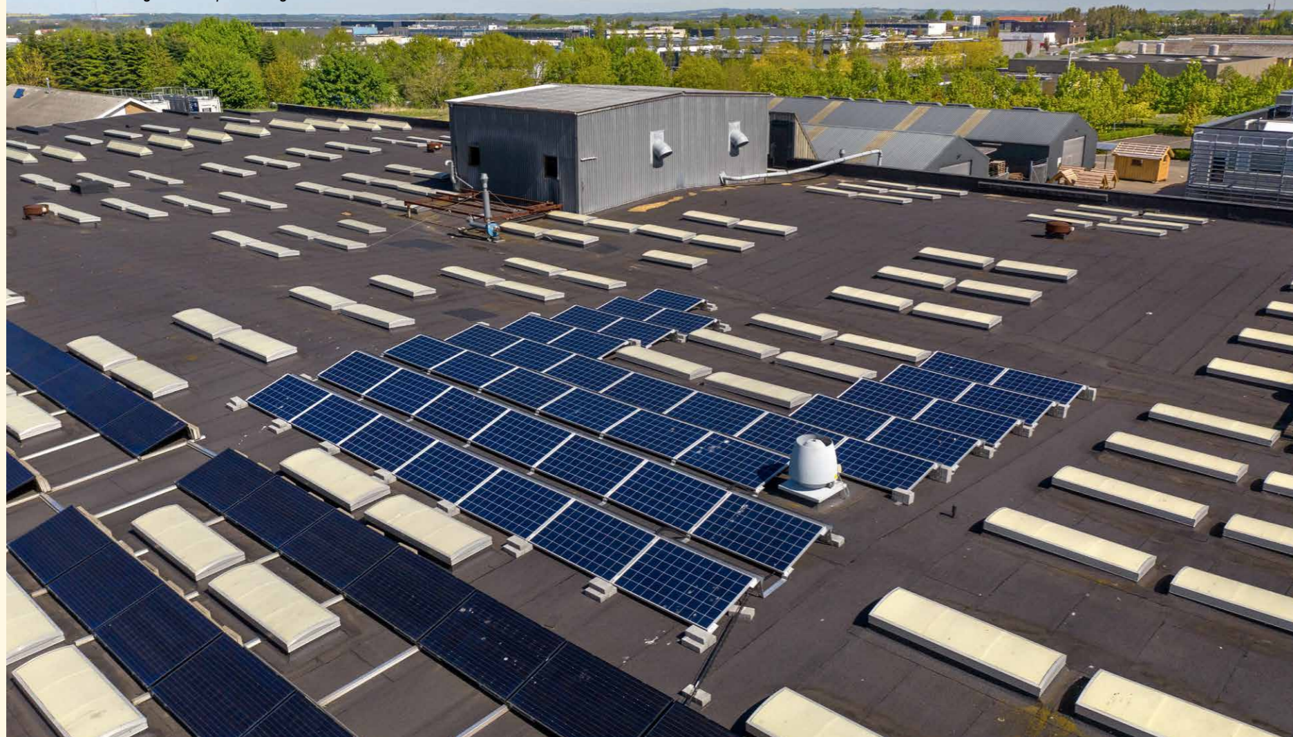
24 kW solcelleanlæg monteret på fladt tag