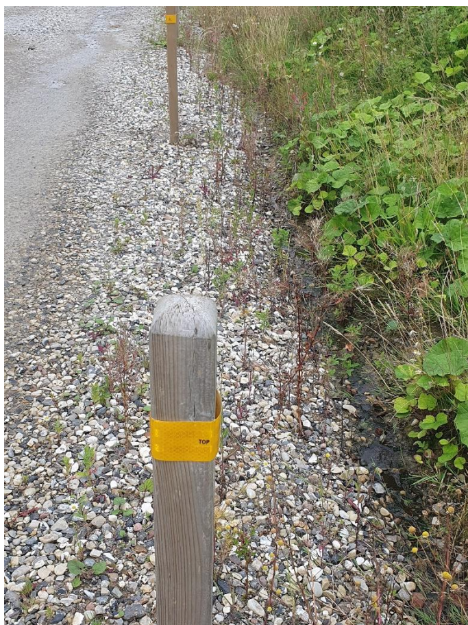
Figur 1 Vandkanal synlig

Ukrudt, der breder sig og næsten ikke synlig vandkanal på to øverste billeder. Vandkanal synlig på nederste billede, og der er stort set altid vand i kanalen ud for de to grønne el-skabe.