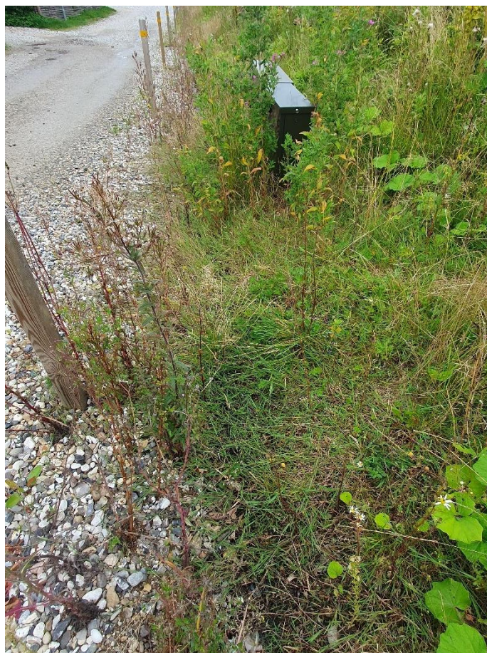
Figur 2 Vandkanal tilgroet til langt ind på Bækkelundsvej

Formand for Grundejerforeningen Bækkelundsvej Øst