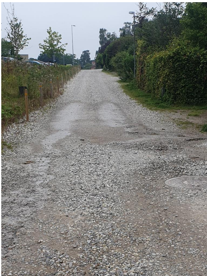
Figur 1 Den våde plet set mod vest

På billederne herunder ses tydeligt, at vejen er tør i overfladen ved siden af den våde plet.