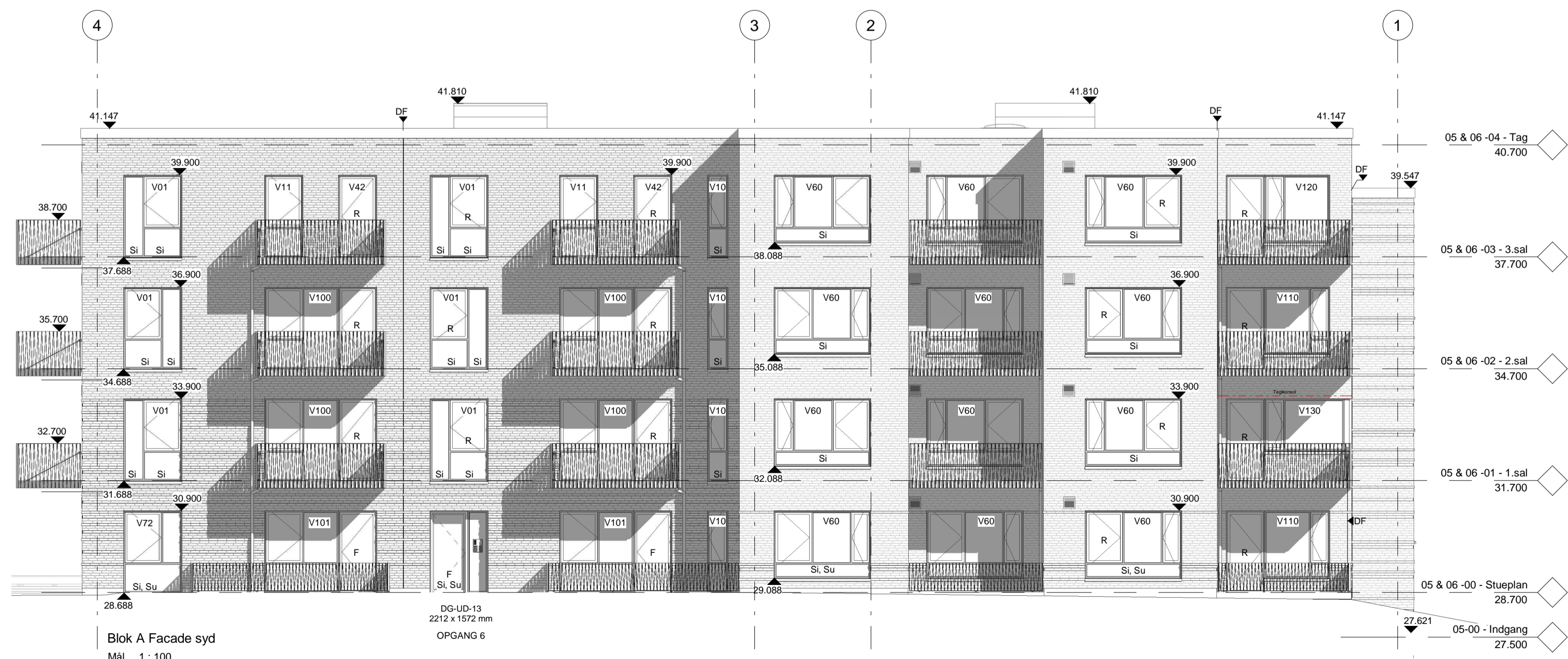
Blok A Facade syd Mål 1: 100