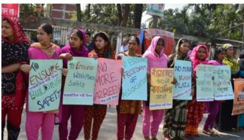
1908 in New York, 2014 in Dacca, arbeidsters uit de textielsector betogen voor betere werkomstandigheden.