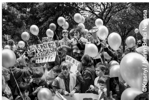
Boven: mobilisatie voor de regularisatie van een leerling in een Brusselse school

Dit is simpelweg een criminele politiek tegenover de rampzalige toestand van tienduizenden mensen die uit alle macht trachten de oorlog, de ellende en de barbarij te ontsnappen die dat kapitalistische systeem in hun landen laat heersen. Dit toont ook aan dat de minachting voor migranten ook minachting en aanval tegen alle werkers betekent. We hebben alle redenen om het te weigeren!