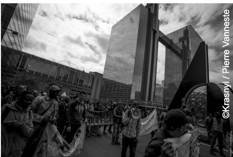
Beneden: mars van mensen zonder papier