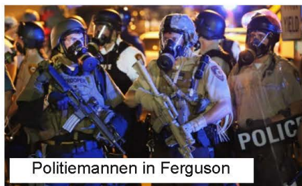
Politie mannen in Ferguson

Zwarte van 44, die staande gehouden werd voor verkoop van sigaretten, is op 17 juli in New-York door politieagenten gewurgd. Op 5 augustus een Zwarte van 22 die een kindergeweer hanteerde in een supermarkt in Ohio waar dat speelgoed te koop was, is door een blanke politieagent gedood; de politieagent is vrijgesproken; Zaterdag 22 november is een zwarte kind van 12 dat in een park in Cleveland speelde met een speelgoedgeweer, gedood door politieagenten, omdat hij hun bevelen niet had gehoorzaamd. Elk jaar doden Amerikaanse politieagenten minstens 400 mensen, waaronder een groot aantal Zwarten.