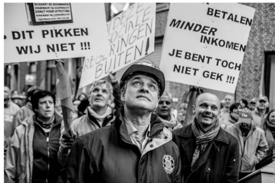
De stakers van Hasselt betogen tegen de antiarbeiderspolitiek van de regering.

Dit is de vraag die men moet stellen, eerder dan nieuwe inspanningen aanvaarden.