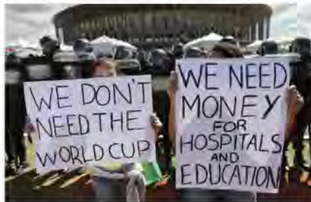
De betogers eisen geld voor de ziekenhuizen en de scholen.

Artikel vertaald uit Lutte Ouvrière (Frankrijk) van 20 juni.