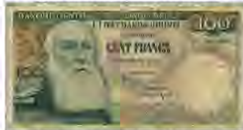
Leopold II, een gemene kerel... op een bankbiljet van "zijn" Congo.

kenden het geweld en de beestachtigheid waarop de overheersing van de imperialistische mogendheden beruiste vroeg voor de gruwelijke feiten op de Europese oorlogsvelden. Ze hebben die in hun