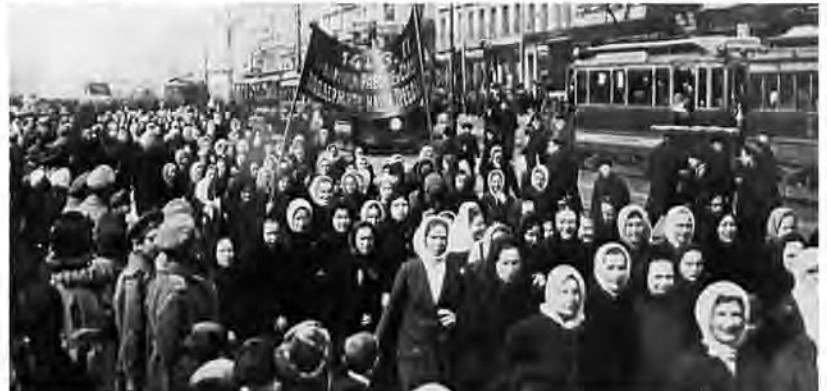
Russische vrouwen betogen tegen de oorlog... Dit is het begin van de Revolutie.