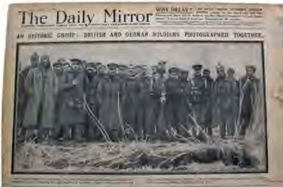
Verbroedering in december 1914: Engelse en Duitse soldaten maken foto's samen.

Het zijn wel de rivaliteiten die door het kapitalistische systeem werden veroorzaakt die tot dit eerste wereldslachtpartij hebben geleid. Net zoals vandaag blijft het imperialisme een tal van conflicten te veroorzaken om met kracht en geweld een onrechtvaardige wereldorde in stand te houden. Alleen de omverwerping van dit systeem zal de maatschappij beschermen tegen het opnieuw verzinken in een conflict zoals diegenen die de 20ste eeuw met bloed hebben bedekken.