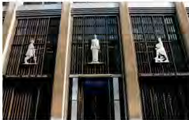
De Nationale Bank van België, net zoals alle banken: ten dienste van de patroons.