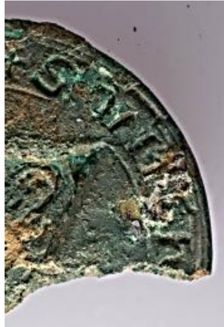
en van deel van het stempel