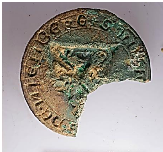
en van deel van het stempel

Op de volgende bladzijde volgen detailstukken om de vergelijking CNS en vondst te vergemakkelijken.