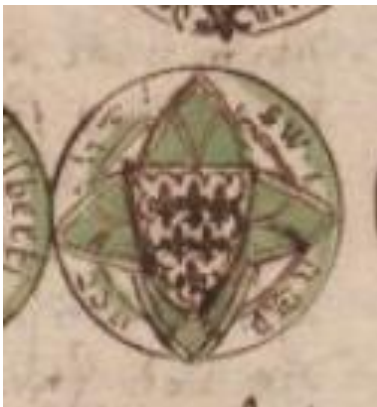
Zegel 14 Sweder van Lambrecht Aertsoon

Sweder van - Lambrecht Aertsoon: bezaaid met lelies (3-2-1) binnen een uitgeschulpte zoom. Omschrift: SW I DER ----HT