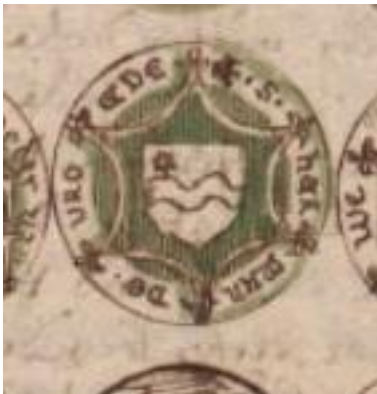
Zegel 8 Harman de Vroede

Harman de Vroede: een golvende balk, vergezeld in de sig. linkerbovenhoek van een ster. Omschrift: W.HER MAN DE. VRO EDE