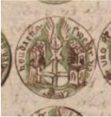
Zegel 7 Sweder van Houdaene