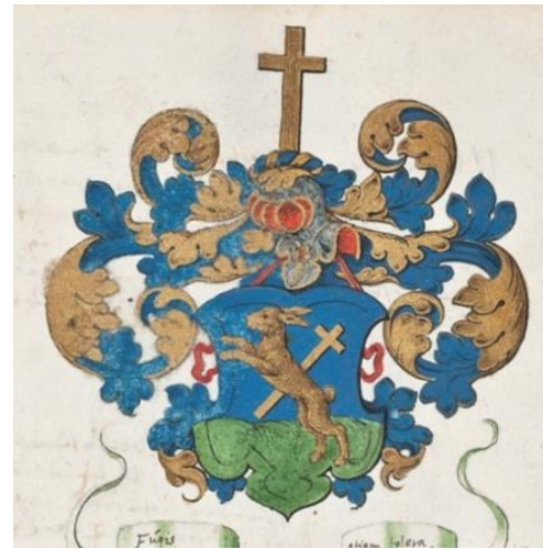
P 160 fol 061r Nicolaus Hasius (ca 1590-?), buitengewoon hoogleraar filosofie te Leiden, s.l. eerste kwartaal 17 de eeuw. Fol. 060v tekst.