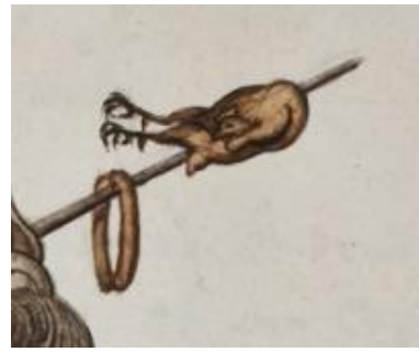
Een kippenbout en een worst.

P 154 fol 116r Gouache van Adriaan Hoffer. Fol 115v tekst