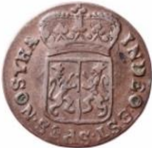
De keerzijde van een GELRIA munt uit 1788 met het wapen van Gelre