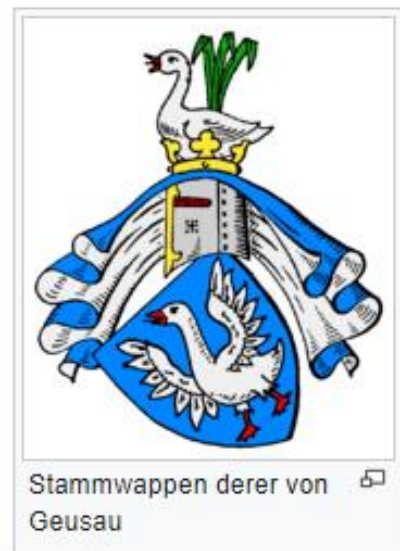
De gans zilver. Helmteken: de gans zittend. Helmkleeden: blauw en zilver. (Adelsgeslacht).