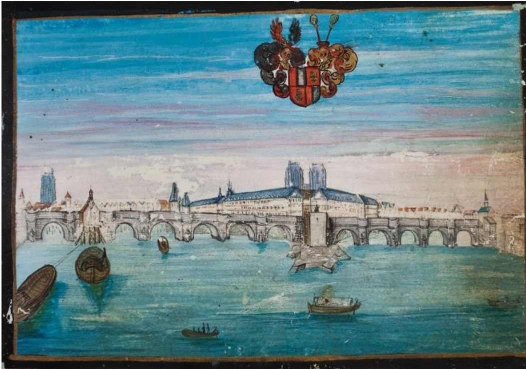
Gezicht op Ile de Cité te Parijs.

Fol 111r Günther von Büнау , Parijs, 31 april 1630.