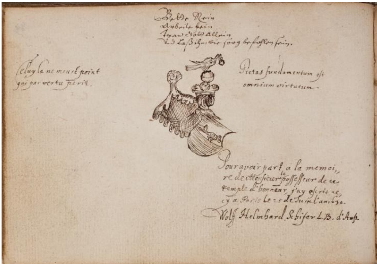
Doorsneden, A. een naar links gewende vogel staande op de snijlijn en met een ring in de bek, B. effen rood (volgens arcering: blauw). Helmteken: een kroon getopt door een bol, doorsneden van zilver en rood, en opnieuw getopt door de vogel van het schild.