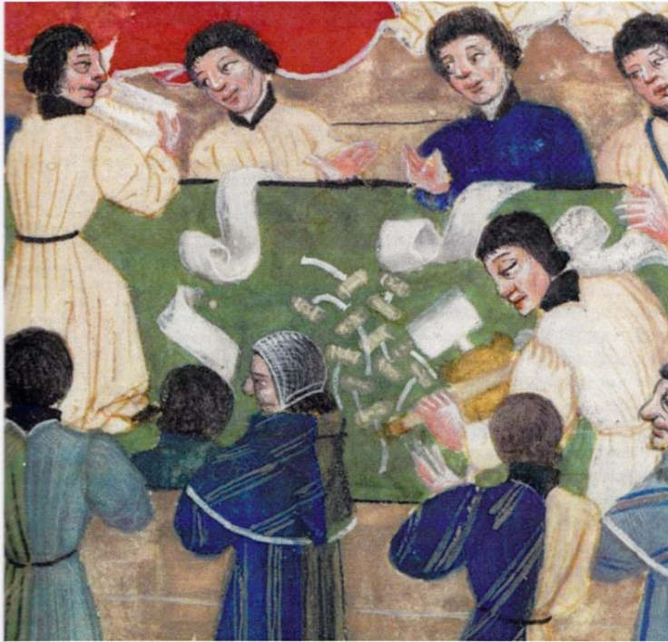
Uitsnede tonende de Espigurnantia (zegelkamer) van de Court of Chancery te Londen. De man met de zwarte kap is the spigurnel (de hoofdzegelaar).

een document dat door Moravische en Boheemse zegelaars naar het Concilie van Bazel gezonden werd. Dit concilie begon in 1431. Het document bestaat uit vier perkamenten bladzijden, die samen gebonden zijn als een boek en waaraan in totaal 452 zegels hangen. Aangezien ik geen afbeelding heb gevonden weet ik niet of alle zegels dezelfde kleur hebben.