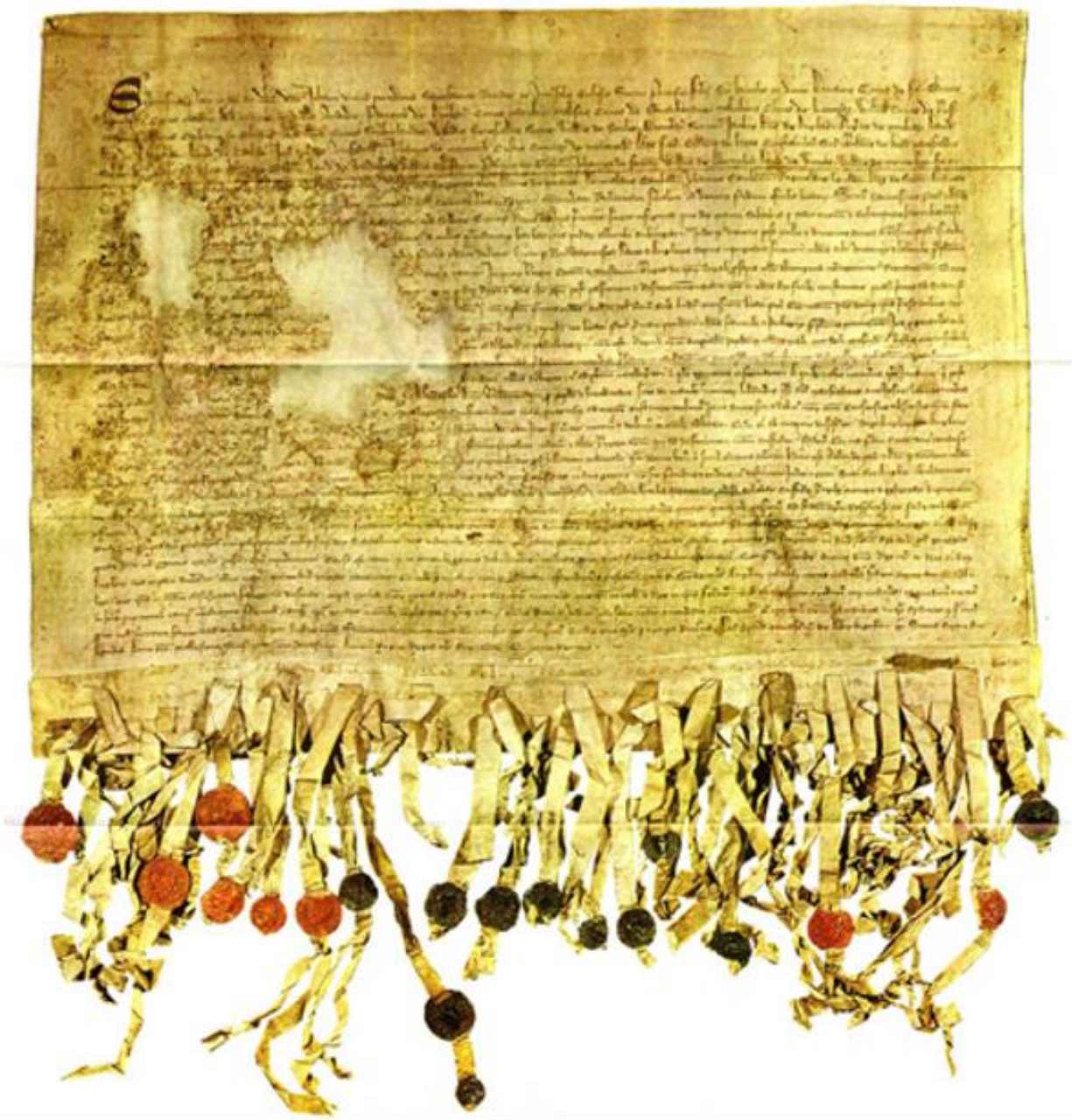
Declaration of Arbroath, 1320. This letter from the Scottish earls and barons asked the pope Johannes XXII to persuade king Edward II to recognize the freedom of the nation of the Scots. Some fifty seals were affixed, mostly at one time, but eleven were added later. Less than the half of the seals survive, but these show that the seals were intended to be in the order of the names on the document, the first half in red wax, the second in green. Scottish Record Office.