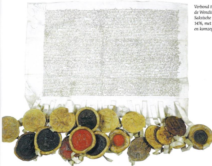
Verbond tussen de Wendische en Saksische steden, 1476, met gewone en komzeglens

De variatie betreft zegelgrootte, zegelvorm en zegelkleur. De laatste variant duidt op meerdere bronnen van de zegelwas, en wellicht op verschillende herkomsten van de zegels.