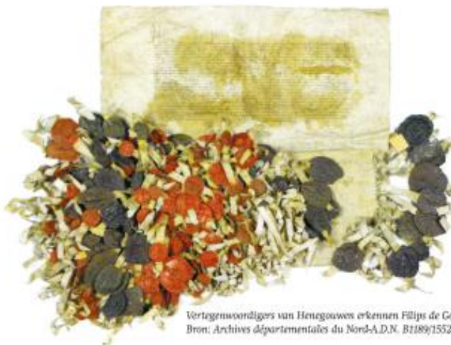
Vertegenwoordigers van Henegouwen erkennen Filips de Goede als landvoogd, 1427.