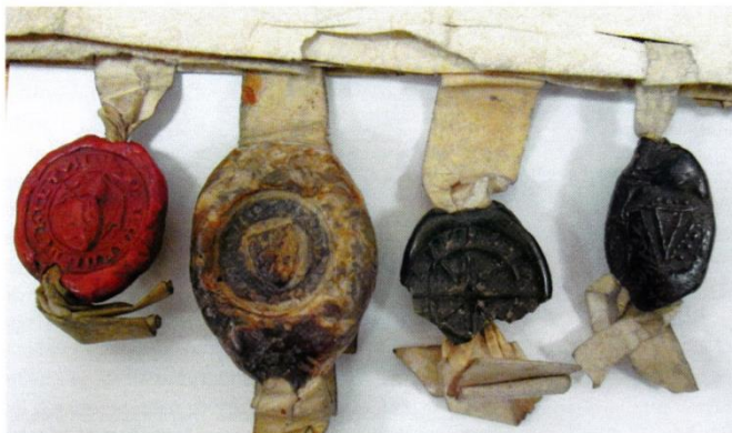
Akte waarin op 18 juli 1420 een nalatenschap wordt geregeld.

Ik veronderstel dat sommige zegels te zwak waren om rechtstreeks aan een staart bevestigd te worden en daarom eerst versterkt werden door de door de bode aangeleverde zegelafdruk te plaatsen op een bodem met rand. 8 Ik voer de afbeeldingen van dergelijke komzeglens van de bovengenoemde Hanzesteden als bewijs aan. Ook hier geldt dat de meeste zegels na 31 oktober zullen zijn toegevoegd.