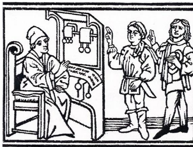
Een middeleeuwse notaris in zijn kantoor. In een rek hangen twee documenten, één met drie zegels en de ander met twee zegels. De notaris heeft een met twee zegels gezegeld document klaarliggen. Twee personen en hijzelf zweren dat in het document de waarheid staat. De twee personen verschillen in maatschappelijk niveau, want de linker persoon is gewapend, gelaarsd en draagt geen hoed. Natekening van een houtsnede uit de vijftiende eeuw. Bibliothèque de Rouen, Col. Le Bov. Nr. 1308 fol. 17. Bron: A. Barabé. Recherches historiques sur le gabellionnage royal. Rouen. 1863

Aan het eind van mijn artikel ga ik in op de wijzen waarop multizegel-documenten werden gezegeld. Waren alle zegelaars op de "zegeldag" aanwezig of