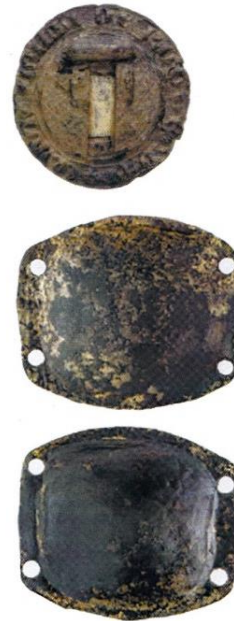
Een messing/geelkoper zegeldoosje of foedraaltje en de sluitzegel uit circa 1300, gevonden te Rotterdam. De waszegel dateert uit circa 1300. Het omschrift luidt CLAVIS SIGILLI . 10

De door bodes te vervoeren losse prefabzegels aan staarten of koorden moesten onbeschadigd aankomen. Ik veronderstel dat zij in verzegelde doosjes en misschien ook in verzegelde leren of textiele zakjes vervoerd werden. Een dergelijk doosje werd in Rotterdam opgegraven met als inhoud het tegenzegel van de stad Rotterdam uit circa 1300.