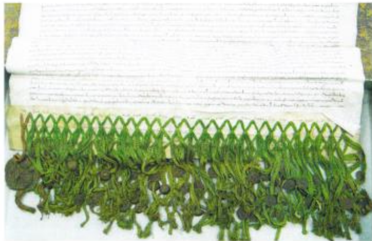
Brugge: een document met circa 78 grotere en kleinere zegels. Statuut opgemaakt door notabelen van Brugge, 1298

In de tros zegels zijn aan de zegelkleur groepen zegelaars te onderscheiden, v.l.n.r. rood - zwartachtig - rood - geen zegel - zwartachtig. Deze groeperingen zullen betekenis hebben. Ik neem aan dat de zegelaars hun zegels aan een staart achterlieten, waarna de klerk vele