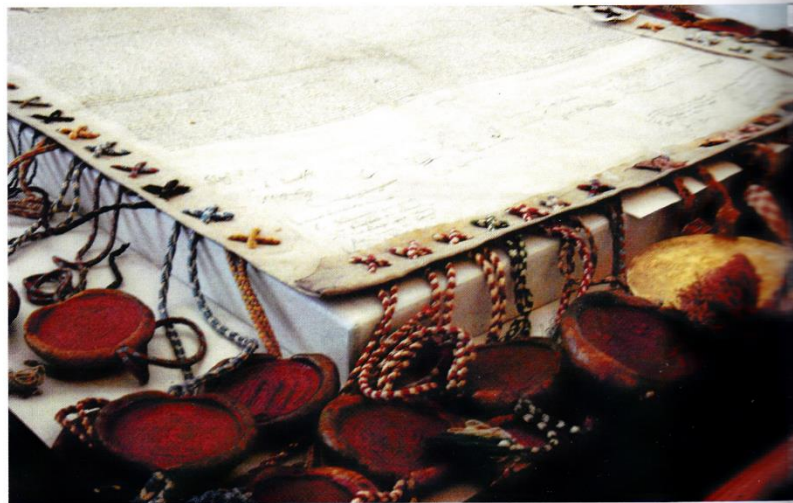
Huwelijksacte van Jacob VI van Schotland en Anna van Denemarken, 1590

klerk zorgvuldig klaargemaakt of werkte hij zoals het uitkwam?