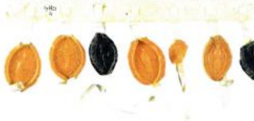
Arbitrage tussen cisterciënzer abdijen, 1247