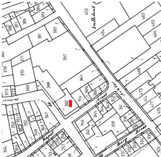
Ligging van perceel 362 op de noordhoek van de Nieuwstraat en Kapelstraat Bron: Kadastrale Atlas 1832.