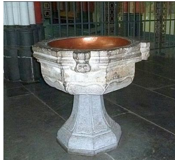
Het bewuste doopvont, verrijkt met koperen bekken.