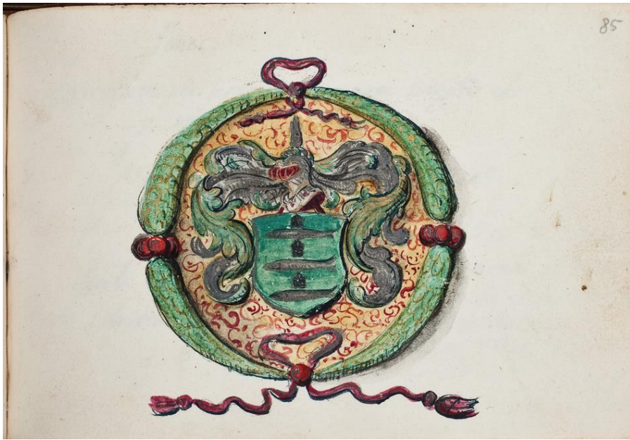
P 39 fol 853 Joannes Floquet , Montpellier, 20 september 1640.