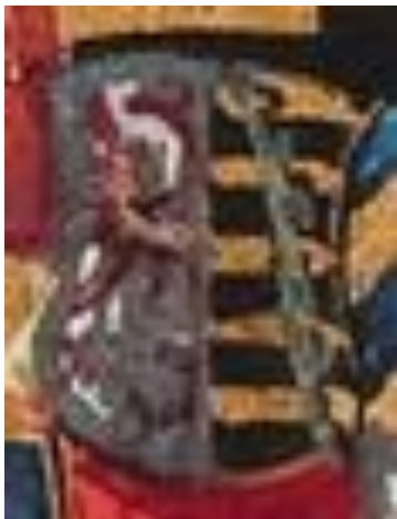
De rode adelaar nauwelijks te zien