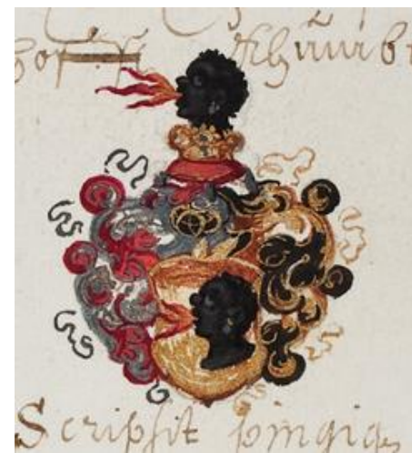
P03 fol 079v Johan de Morio , uit Gröbming, Padua 16 maart 1624

In goud een zwarte morenkop met drie rode vlammen uit de mond. Helmteken: op een gouden kroon de morenkop van het schild. Dekkleden: rechts rood en zilver, rechts: goud en zwart.