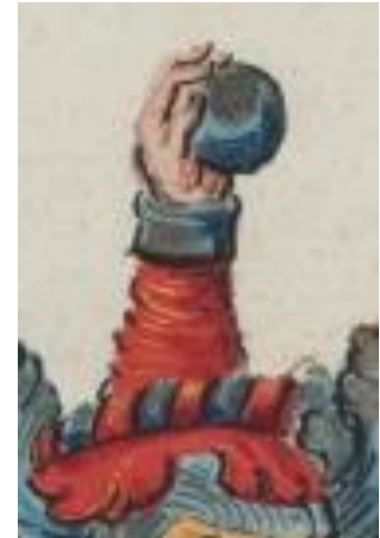
P 315 fol 010r Martinus Boll, s.l. 28 april 1573. Voor AvanLoo.

In rood drie zilveren bollen (2-1). Helmteken: een half naar links gewende helm, met zilveren en rode wrong, waaruit een linkeronderarm omhoog komt, mouw rood en manchet zilver, met in de hand een zilveren bol. Dekkleden: rood en zilver.