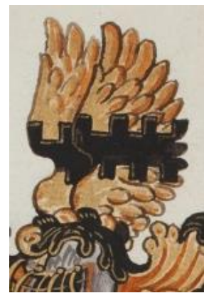
P 332 fol 022r Willem Schoyt, Douai 15 juli 1571. Later: oud-schepen van Antwerpen.

Gevierendeeld, 1 en 4. in goud een zwarte beurtelings gekanteelde dwarsbalk, 2 en 3. in zwart drie zilveren lelies, rechtsboven bedekt door een zwart vrijkwartier met zilveren zoom en beladen met een zilveren vijfbladige bloem; alles binnen een eveneens zilveren zoom. Helmteken: op een zwarte en gouden wrong een antieke gouden vlucht, beide vleugels beladen met de balk van het schild. Dekkleden: zwart en goud.