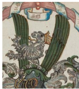
P 329 fol 27r Joannes de Leeuw, Douai 6 juni 1571.

In groen drie zwarte goudgekroonde leeuwen (2-1). Helmteken: op een zilver en groene wrong een uitkomende zilveren goudgekroonde leeuw tussen een groene antieke vlucht. Dekkleden: groen en zilver.