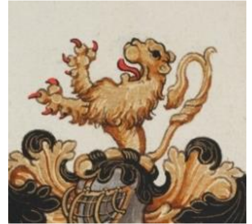
P 333 fol 016r Guilielmus van Weldam, Douai 27 oktober 1571. Willem van Weldam.

In zwart een halve roodgetongde en -genagelde gouden leeuw, vergezeld boven van twee en beneden van één gouden ruit. Helmteken: op een gouden en zwarte wrong de leeuw van het schild uitkomend. Dekkleden: zwart en goud.