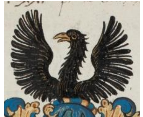
P 334 fol 13r Ludoviscus Capron, Douai 14 april 1571.

Gevierendeeld, 1 en 4. in goud een zwarte goudgesnavelde en -gepote adelaar, 2 en 3. in blauw een gouden lelie; alles binnen een smalle rode zoom. Helmteken: op een gouden en blauwe wrong, waaruit een opvliegende zwarte adelaar met gouden bek komt. Dekkleeden: blauw en goud.