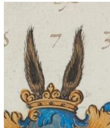
P 314 fol 015r Philippus de Forvy, s.l. 1573. Voor AvLoo.

In blauw tien aanstotende en aangesloten, zilveren ruiten (3-3-3-1), de onderste ruit beladen met een rood kruis. Helmteken: een gouden kroon waaruit een linker gouden en een rechter eveneens gouden ezelsoor steken. Dekkleden: blauw en goud.