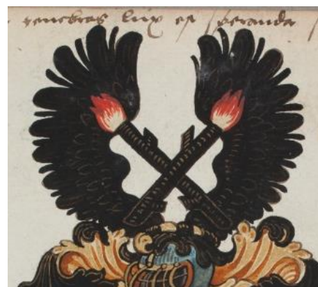
P 331 fol 023r Bernardus Horsinck, Douai 2 juni 1571.