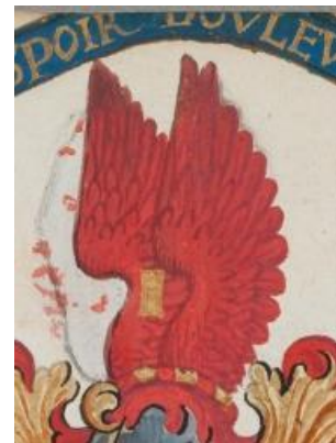
P344 fol 20r Michael Longin, Douai 25 september 1570.

Gevierendeeld, 1 en 4. in rood vijf staande gouden blokjes (2-1-2), 2 en 3. in goud drie blauwe schuinbalken. Helmtaken: op een gouden en rode wrong een antieke rode vlucht, waartussen een zwevend blokje van het schild. Rechts van het helmteken een tak met rode bloemen. Dekkleden: rood en goud.