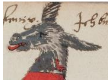
P 346 fol 12r Cornelius Boedtbergh, Douai 16 september 1570.

N.B. De naam, plaats en jaar later bijgeschreven.