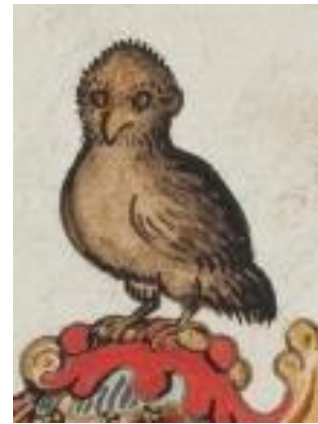
P 325 fol 047v Maximilianus d'Aussy, Douai 6 juni 1571.

Gevierendeeld, 1 en 4. geschakeerd in vijf kolommen en zes rijen, goud en rood, 2 en 3. in blauw een gouden hoge keper binnen een met hermelijnstaartjes beladen zilveren