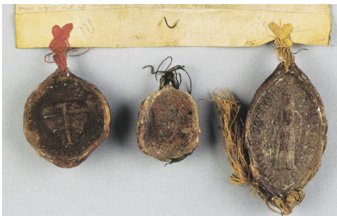
Afb. 2. Charter van Geoffroi de Villehardouin, hertog van Achaïe, ten gunste van de abdij van Clairvaux, (rood) eveneens gezegeld door zijn vader Jean de Villehardouin (zwart) en zijn vrouw Élisabeth de Chappes (gelig), 1216. Ontleend aan Chassel xvi p11

Een voorbeeld met drie kleuren textiel wordt getoond in afb. 2. Waarom gebruikten deze drie nauwverwante personen andere staartkleuren?