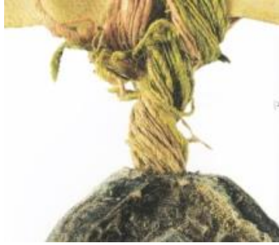
Afb. 6. Een streng van rode, gele en groene draden nabij het zegel ineen gedraaid. Zegel van Philippe de Nemours, bisschop van Châlons, 1228. Ontleend aan Chassel (zie noot 12 p33).