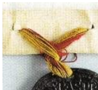
Afb. 15. Bul van paus Innocentius IV in 1248 met een rode+gele streng. Ontleend aan Chassel noot 12 p 26.

Tabel 4. Enige verzamelde gegevens betreffende de strengkleuren van pauselijke charters, ontleend aan Liber Sigillorum van de Ridderlijke Duitse orde xxiii .