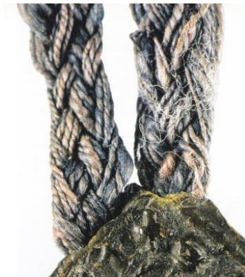
Afb. 11. Gevlochten blauwe en gele gevlochten koorden. Misschien dat sommige draden uit blauwe en gele draadjes bestaan. Zegel van Maître Remi Chevalot, klerk, 1294. Ontleend aan Chassel (zie noot 12 p143).