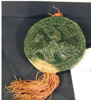
Afb. 13. Ruiterszegel van paltsgraaf Rudolf I, 1296 met rode streng

1360 Willem V, hertog van Julich: rode+groene (afb. 14)