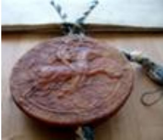
Afb. 18. Ruiterzegel met Hendrik XVI van Beieren. Landshut, 1449. Koord in de Beierse kleuren blauw+wit. Ontleend aan internet.

blauw en zilver/wit (afb. 18). Ik voeg hieraan nog toe dat de kleuren van de zegelstaarten van pauselijke charters de Vaticaanse kleuren rood+geel zijn.