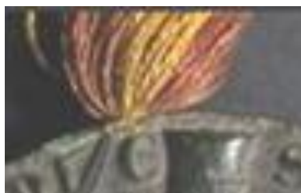
Afb. 5. Een streng van rode, gele en groene getwijnde draden. Zegel van Gilbert de Clare, graaf van Gloucester en Herford, c1218-1230. Ontleend aan www.llgc.org.uk ; National Library of Wales.