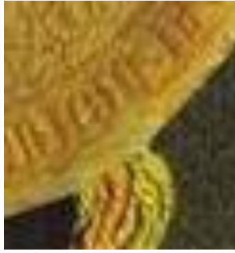
Afb. 14. Ruitersiegel van Willem V van Gulick, 1360 met rode+groene streng. Hessische Staatsarchiv Darmstadt.