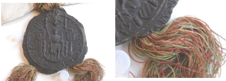
Afb.17. Zegel afgedrukt door Karel V op 12 januari 1528: rode+groene+gele streng. Gemeentearchief Rhenen.

Ik voeg nog toe: ca 1500 keizer Maximiliaan I: goud en zwart koord, ca 1550 keizer Ferdinand I: goud en rood koord, 1538 keizer Karel V (rood en groen), en eerder in 1528: rood+groen+geel (afb. 17).