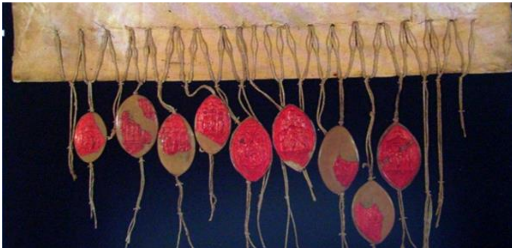
Afb. 16. Aflatbrief uit 1475, gezegeld door 18 kardinalen in Rome.

Een aflatbrief gemaakt in Rome in 1475, en nu bewaard in Het Utrechts Archief-HUA, toont ons de staarten van de oorspronkelijk 18 zegels van kardinalen (afb. 16). Alle zegels werden bevestigd aan een geel koord. xxiv Dit koord zal van één kluwen, aanwezig in het Vaticaan, afkomstig zijn.