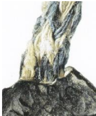
Afb. 8. Gevlochten blauwe en gele koorden. Zegel van Ymer, deken van de christengemeenschap te Robert-Espagne (dept. Meuse) in 1251. Ontleend aan Chassel (zie noot 12 p78).