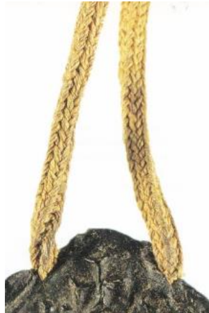
Afb. 10. Twee gele gevlochten koorden. Zegel van de abdij van Montiéramey, 1327. Ontleend aan Chassel (zie noot 12 p83).