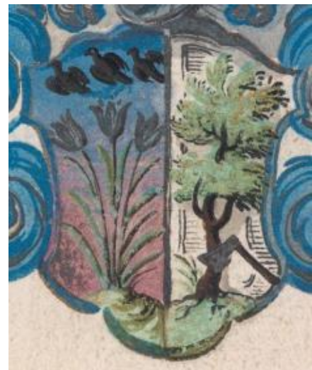
Fol 004r Nicolaus van Sorgen 1604.

Gedeeld, I. in blauw boven en overgaand in lila beneden op een groene grond drie groengesteelde purperen leliebloemen, elke bloem overtopt door een schuin naar rechts vliegende zwarte vogel. II. in zilver op een grasgrond een boom met zwarte vertakte stam en groene kruin. Helmtteken: op een blauwe en zilveren wrong de drie leliën van het schild.