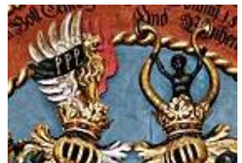
De zwarte man met armen.

//de.wikipedia.org/wiki/christoph_adam_vöhlin_von_frickenhausen/