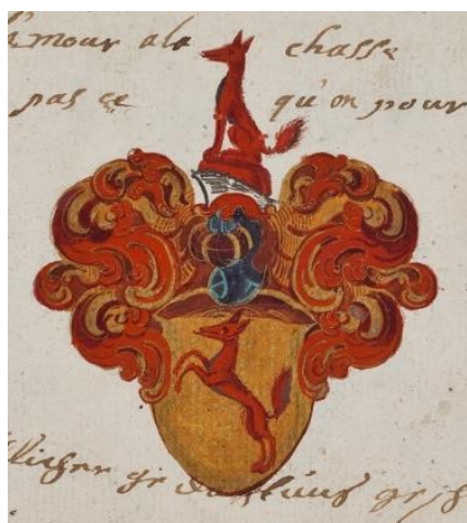
In goud een rode springende vos. Helmtaken: op een helm een rode muts, waarop een rode vos zit. Dekkleden: rood en goud.