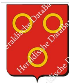
Wapen Winsum

*zie heraldische collectie van het Centraal Bureau voor Genealogie te Den Haag.