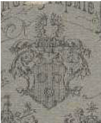
Afb. 2. Wapen van Winsheijm

Ik begin met het bovenste wapen. Dit zal het wapen Van Winsheijm zijn. Een afbeelding van het wapen Van Winsheijm/Winsheim heb ik niet gevonden. Met behulp van de arcering beschrijf ik het als in rood drie ringen. Helmtaken: een vlucht.