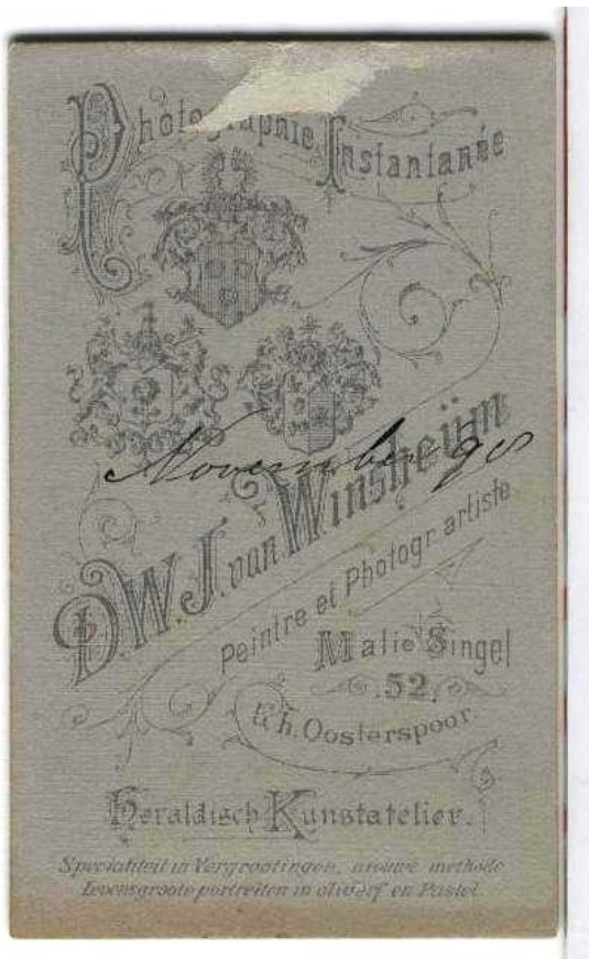
Afb. 1. De achterzijde van een portretfoto, gemaakt door Dirk W.J. van Winsheijm.

In mijn bezit was een portretfoto, waarvan de achterzijde heraldisch interessant is. De foto is gemaakt door Portretschilder en –fotograaf Dirk W.J. van Winsheijm te Utrecht. Aan de achterzijde lezen wij (afb. 1):