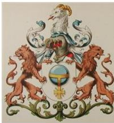
Afb. 3 en 4. Wapen Verschoor. Rechts: uit Hogenda.