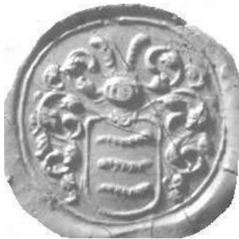
Drie rupsen in het zegel van Herman Worm, 1664. Coll. schrijver. Zeven (2006: 52.21).

wormen boven elkaar. Daarentegen voert Herman Worm, hopman en ‘geërfde in Veluwe’ in 1664 een wapen: goud een blauwgetongde en -genagelde rode leeuw, het veld bezaaid met blauwe blokjes. Helmtteken: de leeuw uitkomend. Ik weet niet of beide personen verwant waren. Misschien kende Henric het oudere wapen van Herman niet.