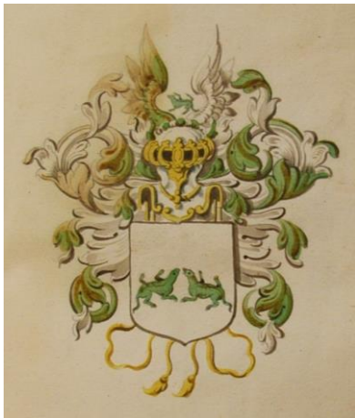
Godefridus Ardesch GOS Handfoto Ad J. de Jong, 2010

Een familie Ardesch voert in zilver twee groene hagedissen. Dit wapen is waarschijnlijk sprekend. Immers in het Duits is een hagedis een Eidesche. Een andere familie Ardesch voert een speer als wapenfiguur. Ook dit wapen is sprekend, omdat een speer ook een esche heet.