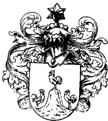
Haanschoten NGV-coll. CW88-1

Symboliseert de adelaar 'kracht', de zwaan doet dat voor 'waakzaamheid'. 24 wapens met een zwaan en drie met een zwanenkop troffen we in onze collectie aan. Een goede derde