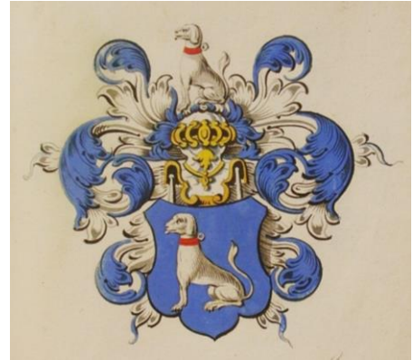
Arnoldus Sluijsken 1656 GOS Handfoto Ad J. de Jong, 2010