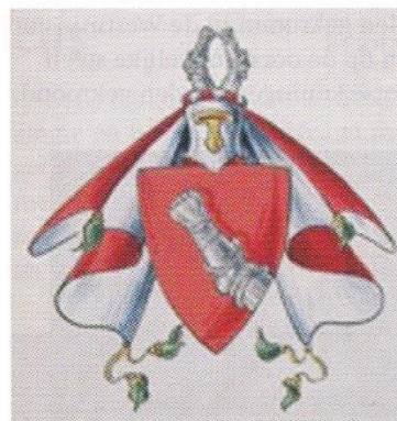
Afb. 2. Drie wapentekeningen door R.T. Muschart, gemaakt voor het Wapenboek Amersfoort, ca. 1918.(4) Om onbekende reden heeft Muschart in het wapen van Wijnbergen het zwart door blauw vervangen.