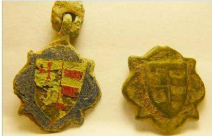
Afb. 6. Twee in Frankrijk gevonden vervelles met hetzelfde wapen. Links vrijwel onbeschadigd, gevonden in Monflanquin, Lot-et-Garonne, Aquitanië. xii , rechts waarvan het emaille is aangetast. Vindplaats niet vermeld.

Van de in afbeelding 6 afgebeelde bodenvondsten is bij de rechter het emaille door humuszuren verdwenen. Te zien is dat de “fijnsmid” x de vorm van het wapen al door uitholling xi had aangebracht, voordat het geëmailleerd werd.