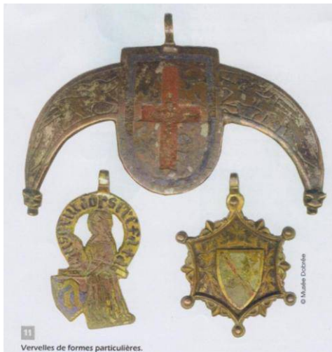
Afbeelding van drie moeilijk te beschrijven vervelles. Musée Dobrée, Nantes. De auteur vermeldt geen afmetingen.

Van William Coolen ontving ik aanvullende informatie over vervelles, die ik graag aan bovenstaande artikel toevoeg. Zijn bron is het artikel door G. Salaün. 2011. 'Vervelles et escussons armoriés.' Histoire et images médiévales nr 29 (mei/juni/juli): 28-30. Salaün verwijst naar zijn bronnen: 1. C. Enlart, 1916. Manuel d'archéologique française depuis les temps reculés jusqu'à la Renaissance deel 3: Costumes ; 2. L. Breton. 2004. 'Vervelles et pendants du Moyen Âge'. Détection Passion no 52, en 3. L. Breton. 2010. 'Les vervelles –'.