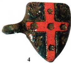
Afb. 8. Een vervelle met een schildvorm. Wapenschild. Uit Labrot, 2005.

Misschien was in het laatste geval het wapen gemakkelijker af te lezen van het schildje aan een halsband van een niet-meewerkende hond.