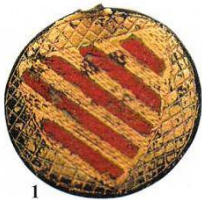
Afb. 9. Ronde vervelle waarvan het ringetje is afgebroken. Wapenschild. Uit Labrot, 2005.