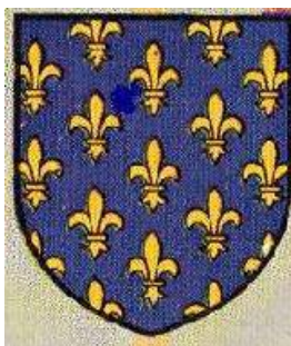
Afb. 4. Wapen van de Franse koning

In deze bestelling werden dus 60 vervelles gemaakt voor de koning (afb. 4) en 36 voor de hertog (afb. 5).