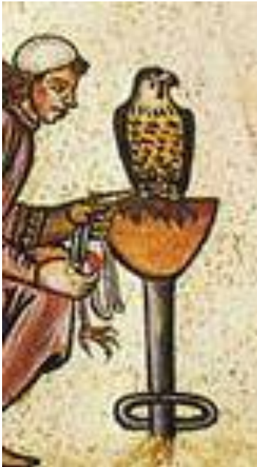
Afb. 12. Een valkenier bekijkt de vervelle. Afbeelding uit De Arte Venandi com Avibus (Over de kunst van het jagen met vogels) door Rooms-Koning Frederik II voor 1250.

Als men afbeeldingen. 2 en 12 uit de De Arte Venandi com Avibus bekijkt, dan lijkt het erop dat een valkenier een rode vervelle vasthoudt. Even dacht ik aan een rode waszegel, maar een dergelijke zegel zal te zwaar geweest zijn.