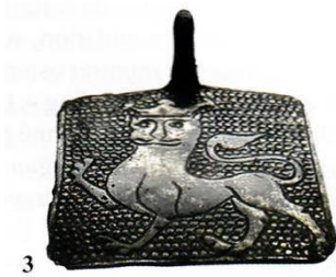
Afb. 11. Trapeziumvormige vervelle. Geen wapenschild. Uit Labrot, 2005.