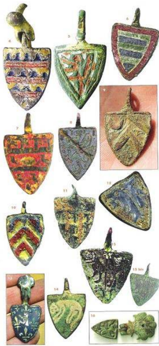
Afb. 7. Een aantal in Frankrijk gevonden vervelles xiii

Vervelles waren tot een tiental jaren geleden vrijwel onbekend; nu worden ze door gebruikers van metaal-detectors op relatief grote schaal gevonden (afb. 7). Met behulp van wapenboeken en andere heraldische en historische bronnen kunnen sommige vervelles waarschijnlijk nog op naam gebracht worden.