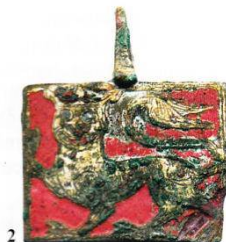
Afb. 10. Rechthoekige vervelle. Geen wapenschild. Uit Labrot, 2005.