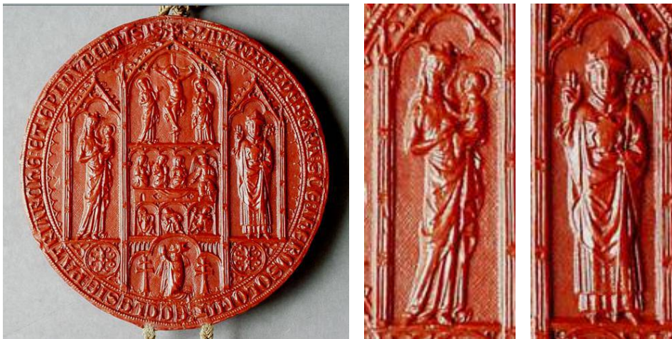
Afb. 15. Knielend Anthony Bek, bisschop van Durham, 1306-1311. Het centrale deel laat de Lijdensverhaal zien, terwijl heraldisch rechts Maria met het kind Jezus staat, en heraldisch links St. Cuthbert.

Het zakenzegel van Richard of Bury, bisschop van Durham, uit ca 1335 (afb. 13) tont ons Maria met het kind Jezus; zij zit heraldisch rechts van de St. Cuthbert. Op het zegel van Robert of Lancaster, bisschop van St. Ataph (Wales) uit 1411 (afb. 14) zien we in het midden Maria en kind, geflankeerd door heraldisch rechts St. Peter (kort, gekruld haar en mogelijk een sleutel) en heraldisch links St. Paul (langer haar en een zwaard).