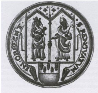
Afb. 16. Het schepenzegel van Obbicht en Papenhoven uit 1616. Heraldisch rechts Maria, links St. Willibrordus, kerkpatroon.

Ook Franckewitz en Venner 19 beschrijven in 1987 de non-wapenzegels heraldisch, zoals beschrijvingen van de schepenzegels van Obbicht/Papenhoven en Afferden aantonen (afb. 16 en afb. 17). In het zegel van Obbicht/Papenhoven wordt Maria heraldisch rechts van St. Willibrordus, kerkpatroon beschreven. In het zegel van Afferden staat St. Cosmus met de zalfpot heraldisch rechts van St. Damianus.