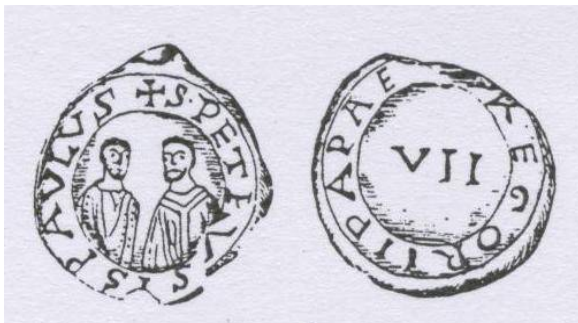
Afb. 29. Afdruk (tekening) van het zegel van paus Gregorius VII (1073-1085). De namen van

Ook een opvolger van paus Clemens, paus Gregorius VII (pontificaat 1073-1085) zegelde met het Petrus en Paulus zegel (afb. 29). Petrus is hier gekenmerkt door een pallium, kenteken van een aartsbisschop. Ook hier is Petrus voor de beschouwer rechts afgebeeld en Paulus links. Daarnaast wordt door het omschrift aangegeven wie Petrus en wie Paulus is. Ook later