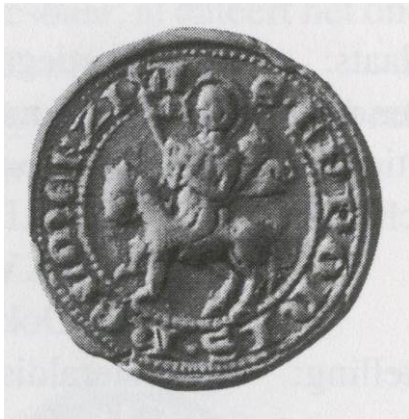
Afb. 27. Zegel met een Heilige te paard, 13 de -14 de eeuw. Uit Zijlstra 40 (1985). De halo geeft aan dat hij een heilige is.

zijde, van zegelafdruk no 40 de linkerzijde. Beide zegels worden beschreven als Lam Gods . Niet aangegeven wordt welke flank van het dier te zien is.