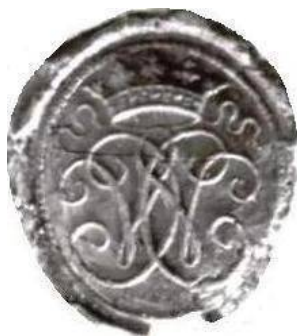
Afb. 9. Een dubbele monogram van de letters C en W. Zegel van Cornelis Wilt, uitgever te Amsterdam. Amsterdam, 25 maart 1762. Gemeentearchief Wageningen. Zeven 13 : nr 27.12.