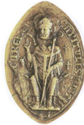
Afb. 20. Grootzegel van de Abdij Saint-Remy of Remigius van Reims (1219). Uit Chassel et al. 24

Chassel, Bur & Pastoureau 25 beschrijven in 2003 het grootzegel van de Abdij Saint Remy of Remigius heraldisch, want volgens hen kijkt St. Remigius naar rechts (afb. 20).