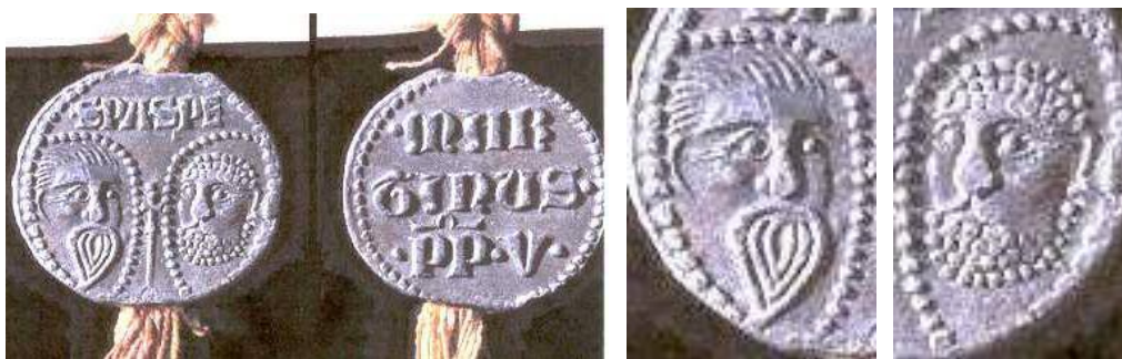
Afb. 31. Bul van paus Martinus V (1368-1431). Links het apostelzegel met de koppen van Paulus (heraldisch rechts met lange baard) en Petrus (heraldisch links met krullend hoofdhaar en baard), en details van de hoofden.

Beide pauselijke zegelstempels tonen een afdruk waarbij Petrus rechts en Paulus links wordt afgebeeld (afb. 30 en 31). Rond 1555 werd dit pauselijke zegeltype afgeschaft.