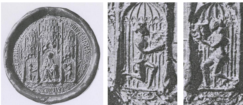
Afb. 16. Zegel van de Universiteit van Keulen. Uit: Kittel (zie noot 15).

Kittel 18 beschrijft in 1978 een zegel van de Universiteit van Keulen (afb. 15), als in het midden de tronende Petrus als beschermheilige van de universiteit met rechts de stichter Kurfurst Ruprecht I met een schild beladen met de Beierse ruit en links de stichter Kurfurst Ruprecht II von der Pfalz met het leuwenschild. Hij beschrijft dus dit zegel heraldisch.