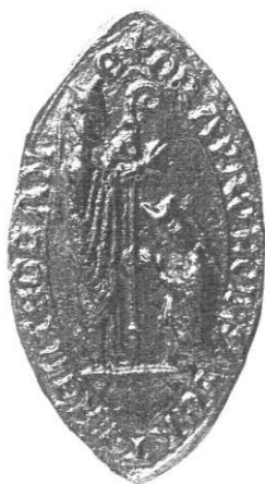
Afb. 11. William of Bondington, 1233