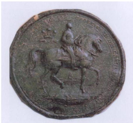
Afb. 21. Zegel van George III, 1774. Volgens Williams 26 gaat de ruiter naar rechts.