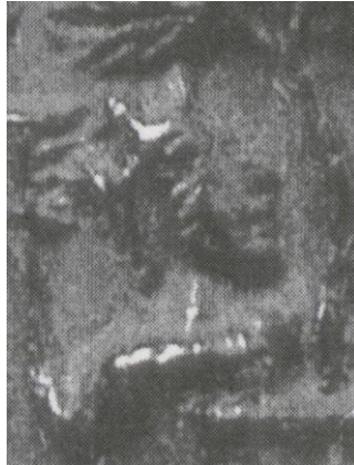
Afb. 19. Zegel van N. Isser (1380) met de kop van Neptunus (detail) Uit Fabre 23