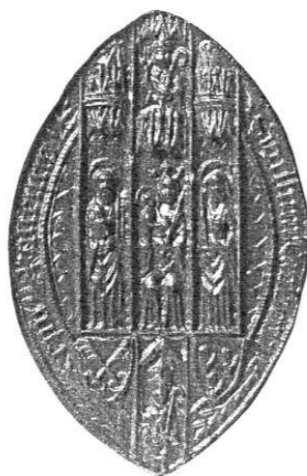
Afb.14. Robert van Lancaster, bisschop van St. Ataph of (Noord- Wales), 1411, met detail van de bisschop en de , twee heiligen: heraldisch rechts Petrus en links Paulus

Beide zegels uit: Harvey & McGuinness 17