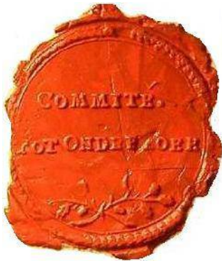
Afb. 10. Comité tot onderzoek (van paspoorten te Amsterdam), Amsterdam, 15 oktober 1795. Gemeentearchief Wageningen. Zeven 14 : ongenummerd.

Zie voor Tekstzegels ook beneden bij de pauselijke zegels (para. 4).