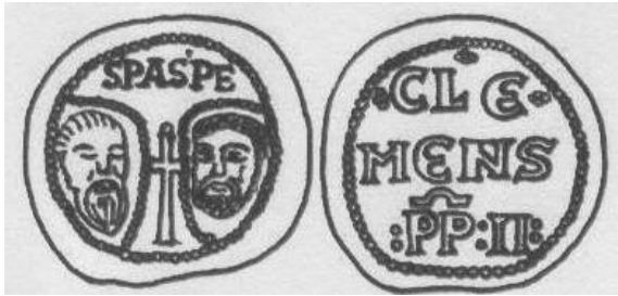
Afb. 28. Voor- en keerzijde van het zegel van paus Clemens II (1046-1047).

belangrijker is dan Paulus. 48 Het bovenstaande kwam bij mij naar voren bij het bekijken van bullae van vele pausen. De vroegste aan mij bekende afbeelding van een pauselijk bul is die van Clemens II (pontificaat 1046-1047) (afb. 28). Toen tijdens het pontificaat van Clemens II (of van een voorganger) het toen nieuwe pauselijke zegel werd ontworpen bekeek men het zegel niet met de ogen van een heraldicus, maar met die van een zegelaar. Immers een heraldicus bestond nog niet. Voor de zegelaar was toen de rechterkant de belangrijke kant en daarom plaatste hij Petrus aan die zijde, en Paulus aan de linkerkant. Daardoor wordt ook de volgorde van de tekst SPASPE in het zegel bepaald, want deze moet gezien worden als een bijschrift. De voorzijde van het zegel is dus geen tekstzegel de keerzijde is dit wel (zie para. 2.3).