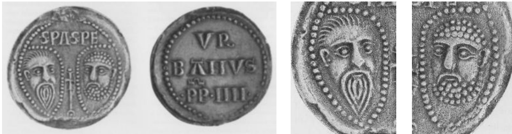
Afb.30. Bul van paus Urbanus IV uit 1262. De details tonen St. Paulus (heraldisch links) en St. Petrus (heraldisch rechts). Uit Demouy 51 .

de heiligen staan nog bij hun beeltenis. Uit Kittel 50 (1978) afb. 233f.