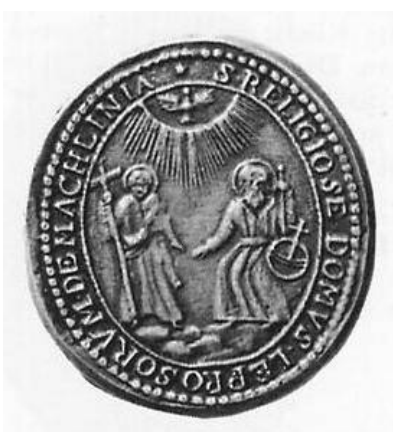
Afb. 18. Zegel van de Leprozen van Mechelen.

Danny van Grasdorff 21 beschrijft het zegel van de Leprozen van Mechelen (afb. 18) als links staat Sint Jan met aureool en lang kleed. Hij draagt een kruis in de rechterhand; rechts zit Sint Paulus, eveneens met aureool en lang kleed. Hij houdt een zwaard in de linkerhand. Naast hem de keizerlijke wereldbol. Boven in het zegel een duif als symbool van de Heilige Geest. Zijn beschrijving is dus niet-heraldisch.