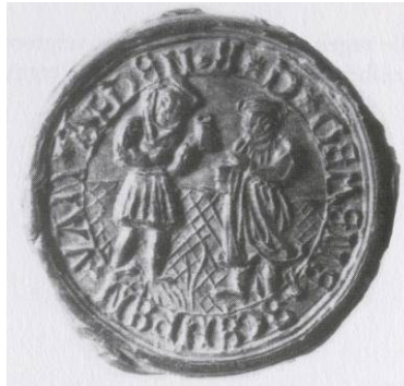
Afb. 17. Het eerste schepenzegel (1534-1573) van Afferden. Heraldisch rechts St. Cosmus met zalfpot, links St. Damianus.