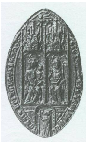
Afb. 13. Zegel van Richard of Bury, bisschop van Durham, ca 1335