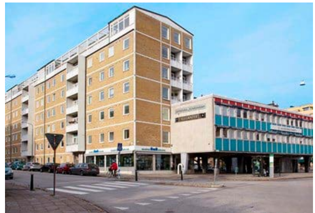
Brahehus är ett centralt beläget fastighetskomplex uppfört i slutet av 50-talet på Fridhemstorget i Malmö.

Att tekniken är certifierad enligt ledande standards för hand- och ytdesinficering samt godkänts enligt biociddirektivet, bidrar till ett ökande intresse från kunder inom vitt skilda sektorer som fastighet, agro, vård, utbildning och industri.