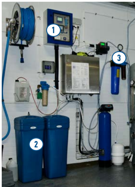
Anolytechs system som producerar AnoDes på plats består av en styrenhet monterad på väggen (1), behållare med salt (2) och en blandningsmodul (3). Bilden visar en standardinstallation.