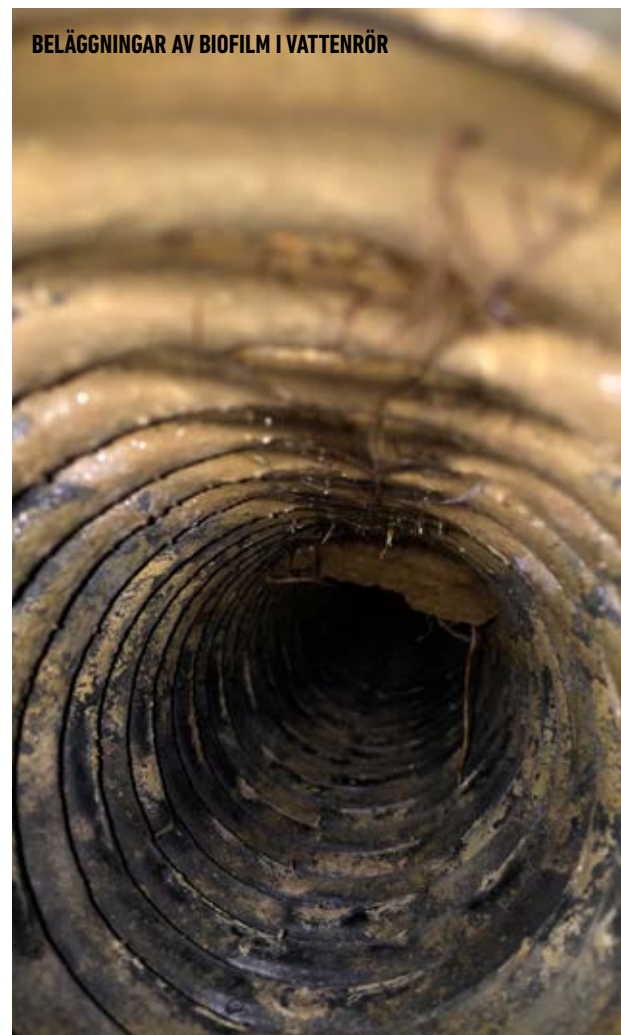
Vanligt förekommande beläggningar av biofilm i ett plaströr. Biofilmen fungerar som ett skydd för bakteriesamlingarna och försvårar eliminering av bakterierna.

Eftersom AnoDes produceras på plats finns desinfektion alltid tillgänglig och systemets enkla hantering garanterar en driftsäker produktion året om. Den lättplacerade anläggningen består av en väggmonterad styrenhet, en saltbehållare och en blandningsmodul. Det enda som krävs är tillgång till elektricitet, vatten och avlopp. Under driften behöver anläggningen endast fyllas på med salttabletter.