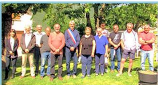
LE CONSEIL MUNICIPAL

Vœux de Monsieur le Maire à 18 h 30 dans la salle polyvalente