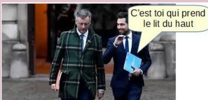
En photo ses premiers clients.

Tout Durbuy étant occupé il s'est rabattu sur Laeken.