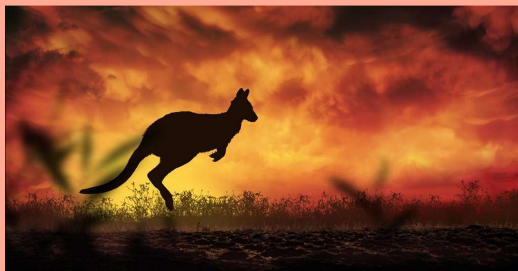
L'Australie continue à inquiéter les décideurs

Pendant 30 ans le monde des affaires a fait la sourde oreille aux conseils et prédictions des scientifiques. Maintenant, après les incendies d'Australie, de Californie, de Laponie et de Sibérie, il se réveille enfin.