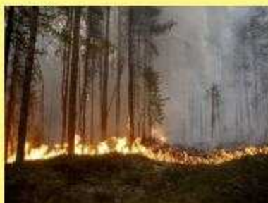
Feu de forêt en Suède à Karbole, le 15 juillet 2018.

Deux degrés, Trois degrés, un degré et demi. Peu importe les chiffres. Car les conséquences de ces prévisions sont effrayantes.