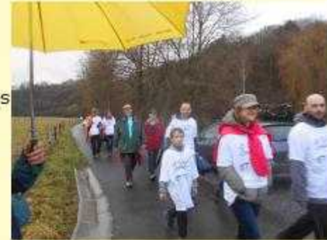
A mi-chemin, à Bohon

Pour inverser le réchauffement climatique nous devons changer nos attitudes ; au niveau individuel, mais aussi au niveau de notre civilisation.