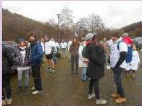
Départ, Pré Joris, Durbuy

contrôler notre chauffage ainsi que notre conditionnement d'air, restreindre nos transports et limiter nos appareils électriques. Il nous faudra aussi diminuer notre consommation de viande et nos achats de vêtements. Mais sommes-nous prêts à ces sacrifices ?