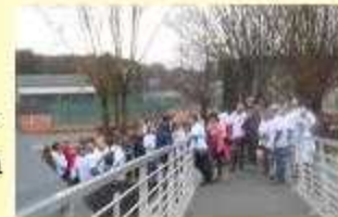
Arrivée à Bohon

Dans ce cadre Elio di Rupo a proposé d'investir 5 milliards d'euros dans les transports en commun. Il a raison, les citoyens laisseront l'auto au garage s'ils disposent d'une alternative intéressante.