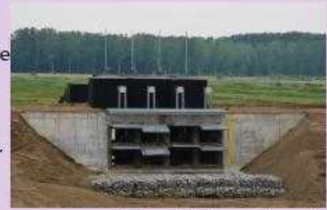
Chenal à Ruppelmonde

Je me souviens des effets de la tempête aux Pays Bas en février 1953. Des vents violents et une marée de vive eau (le soleil renforçant la force d'attraction de la Lune) ont créé cette inondation, plus de 1800 morts. En réaction, les Pays-Bas ont construit les digues