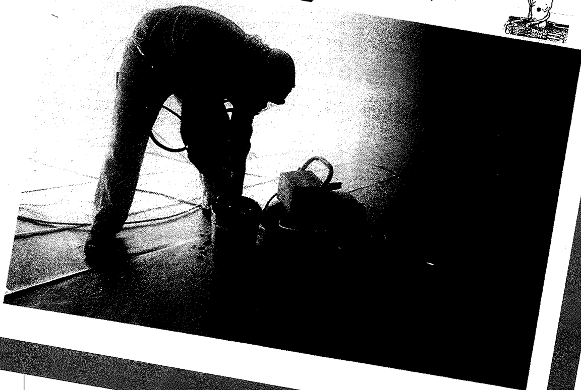
Fra AAA's kampagneavis mod EF-pakken i maj 1984