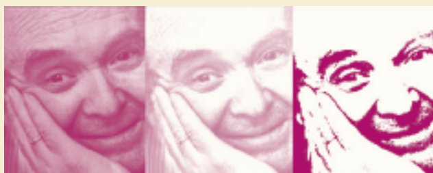
Vicent Andrés Estellés.