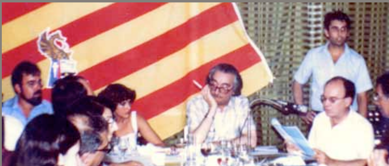
Vicent Andrés Estellés recitant, en l'Homenatge de l'ABC a les Forces de la Cultura del País Valencià (1979). A la seua dreta Joan Fuster i a l'esquerra Enric Valor.

L'objectiu d'aquest article és recordar el gran poeta valencià Vicent Andrés Estellés i les mencions a Borriana en la seua extensa obra. El poeta fou nomenat Síndic d'Honor de l'ABC en 1979 (quan se li tributà un homenatge al restaurant Morro juntament amb figures com Joan Fuster o Sanchis Guarner). Aquest 23 de setembre, a més, l'ABC i la societat gastronòmica La Canella van organitzar el primer Sopar Estellés al restaurant Brisamar II. I no serà l'últim.