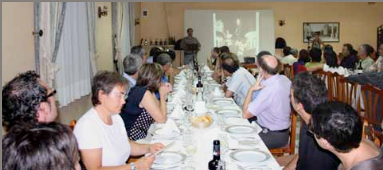
Una imatge del Sopar Estellés organitzat per l'ABC i La Canella.

versos de la segona estrofa, remet a evocacions basades en uns records més recents situats sobretot a Peníscola però on es nomenen de manera perifèrica altres pobles de camí cap a València ("vaixells de Borriana, torres d'Onda").