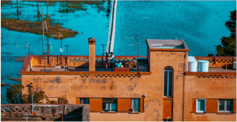
Home estenent al grup Roger de Flor després d'una plouguda durant el confinament

La mar nostrada és el bressol de moltes de les grans cultures que han conformat el pensament d'Europa, però també d'Àsia i del nord d'Àfrica: Egipte, l'Antiga Grècia, Mesopotàmia i l'Iran; celtibers, berbers, eslaus i cartaginesos. Els romans la varen batejar com a mare nostrum i així s'ha quedat. Des del començament dels estudis de filosofia, em té captivada la teoria evolutiva d'Anaximandre per la seua precocitat. Segons aquest filòsof presocràtic, els primers animals haurien sorgit de la mar escalpada pel Sol. El que deia Anaximandre fa vint-i-sis segles ho van constatar les teories evolucionistes de Lamarck i de Darwin despús-ahir. Bum! Tanmateix, la mar, mare de la vida, també engendra mort, com tots els ventres de dona poden engendrar –i poc se'n parla, per no dir que això s'oculta perquè no fa bonic ni és un problema que es geste als no-úters dels senyors.