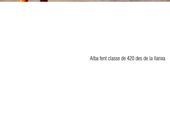
Alba fent classe de 420 des de la llanxa