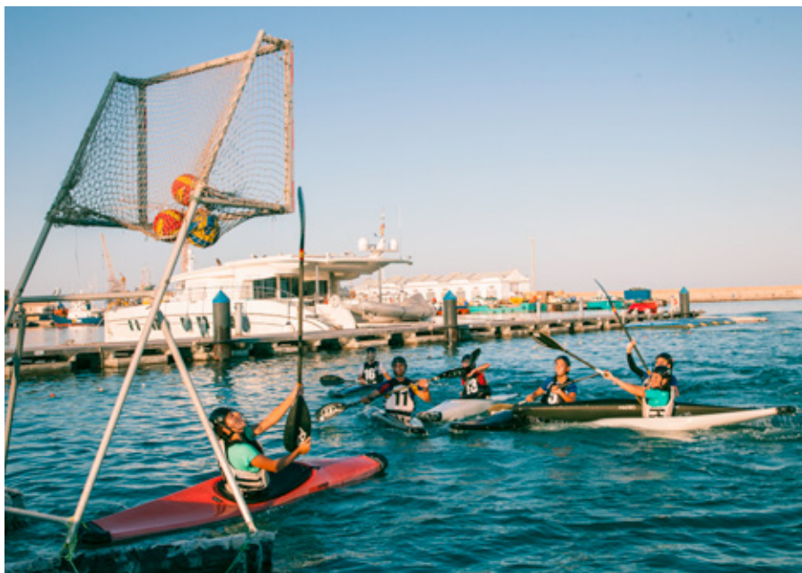
Jugadores sub16 del Club Atlètic Caiacpolo Borriana entrenant