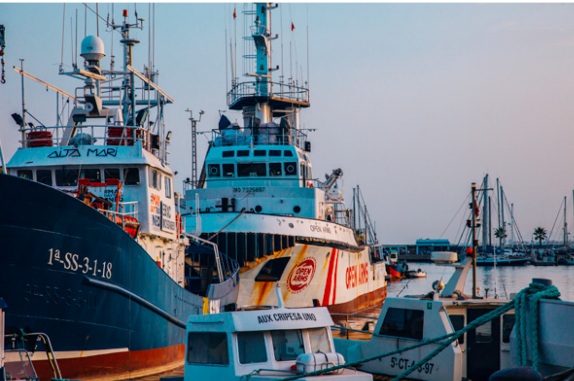
Foto de l'Aita Mari i de l'Open Arms, entre d'altres barques, amarrats al Port de Borriana a l'estiu de 2021

Com en Ulisses , nosaltres també hem observat que, quan les dones conten la seua història a la mar, ho fan amb zero pedanteria i no contenen només el que han arribat a aconseguir, sinó també tot el procés que les ha dutes fins on estan. A més, per norma general, les dones ens autoexigim molt més que els hòmens en contextos masculinitzats perquè hem de demostrar més. Tindrem igualtat quan hi haja dones que arriben i que no siguem tan vàlides. Els llocs de poder estan farcits d'hòmens mediocres, però a les dones no se'ns permet arribar amb el pretext que ens ho hem de guanyar .