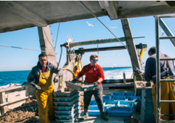
La tripulació del Simar triant peix