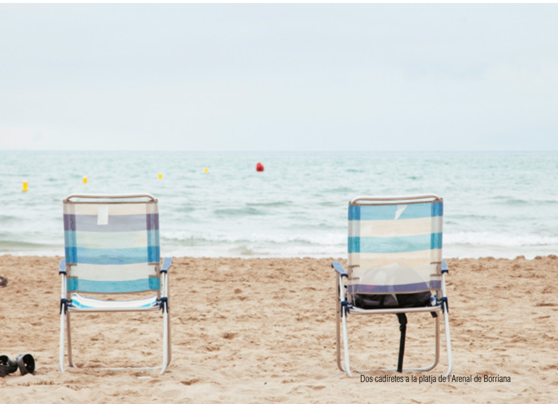
Dos cadiretes a la platja de l’Arenal de Borriana