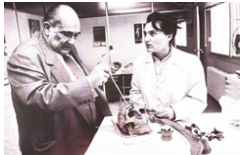
Asun amb son pare analitzant les restes del presumpte Pirata de les Columbretes

Mirem un suro que hi ha a l'entrada del centre. Hi ha un díptic de la Unitat Terapèutica Hiperbàrica de l'Hospital General de Castelló. No