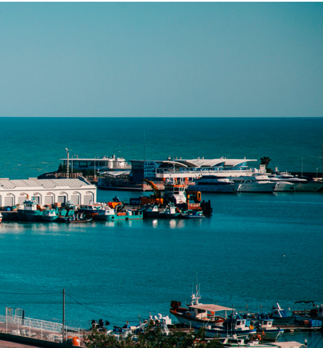
Vista del Port de Borriana des de l'edifici del Savarín