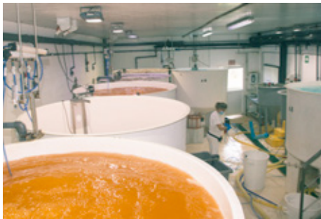
Els cultius d'aliment microscòpic per als peixos