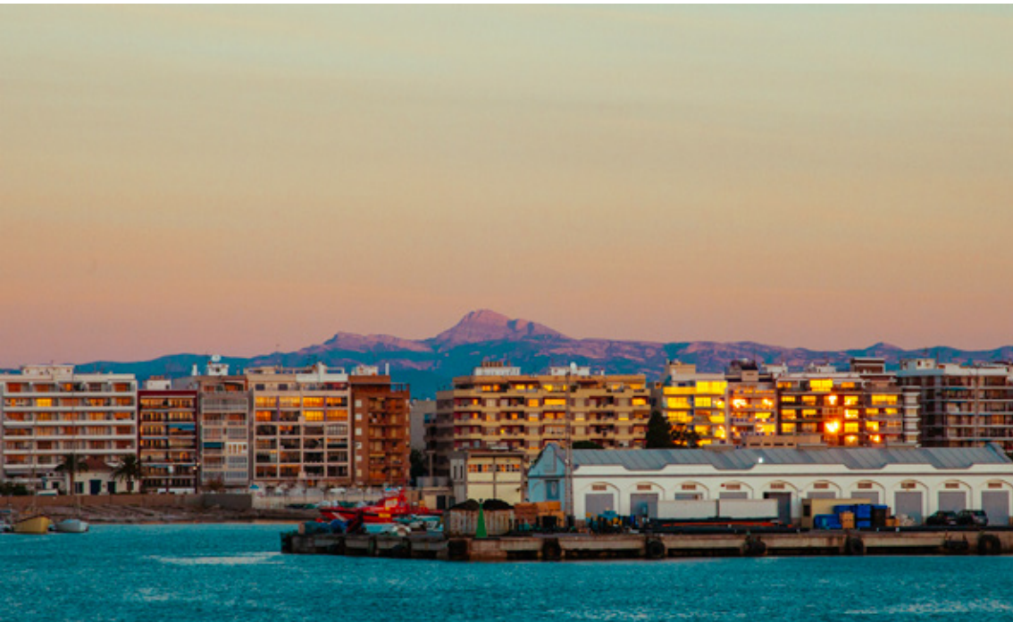
Vista del Penyagolosa des de l'Espigó de Llevant del Port de Borriana