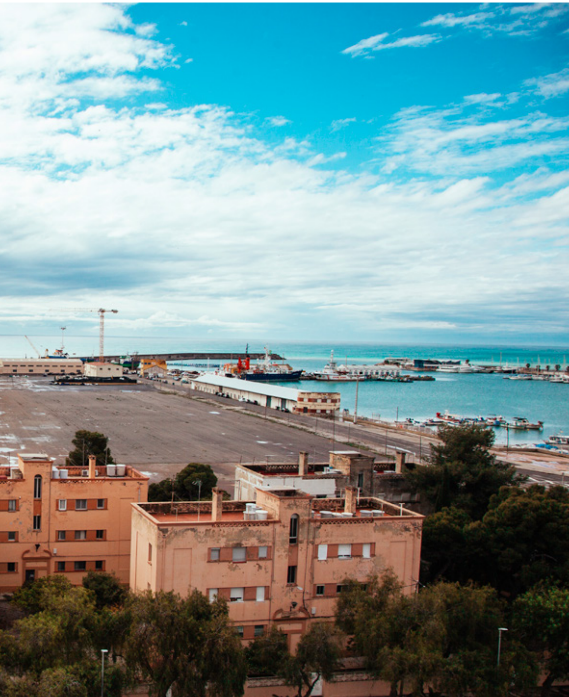
Vista del grup Roger de Flor, del Port i dels terrenys sobre els quals es munta l'Arenal Sound des del terrat de l'edifici del Savarín