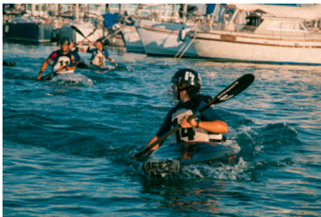
Jugadores sub16 del Club Atlètic Caiacpolo Borriana entrenant