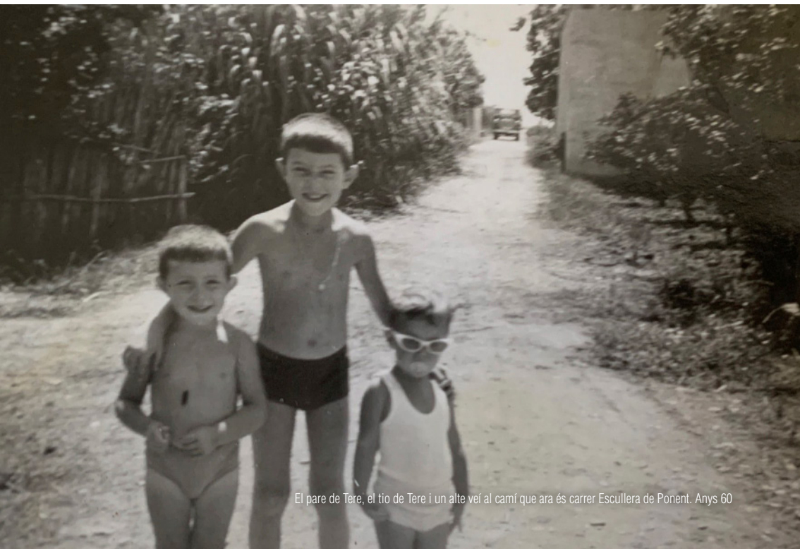
El pare de Tere, el tio de Tere i un alte veí al camí que ara és carrer Escullera de Ponent. Anys 60

Vaja per davant que no sé del cert si la història que contaré és així, però potser sí. Una dona que té tres filles i un marit que la maltracta. Una dona que ara té una vuitantena d'anys i un poc de demència. Estava casada amb un guàrdia civil que bevia