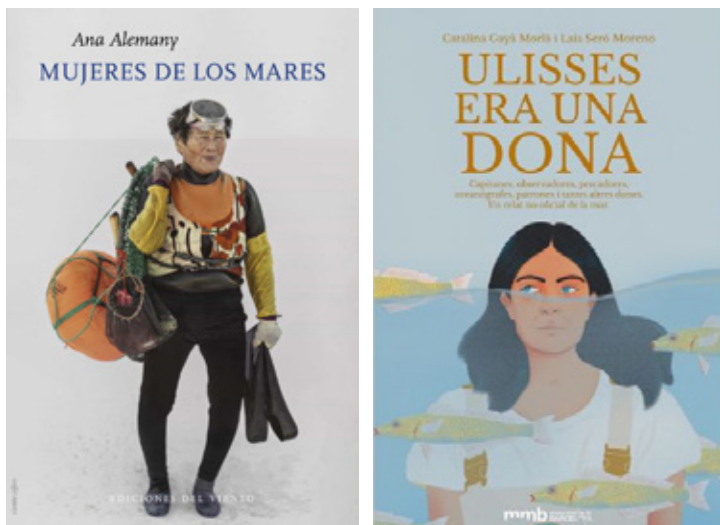
Portades dels dos llibres que més han influït el projecte de La mar de dones a Borriana