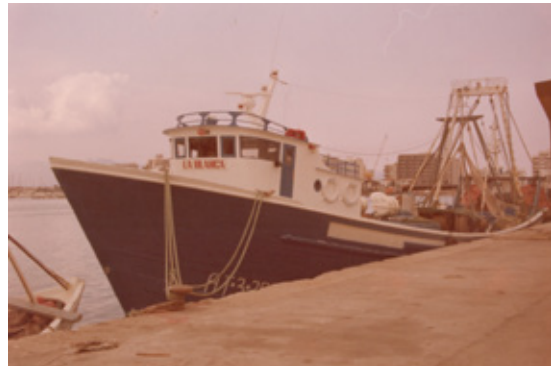
La Blanca (anys 80)