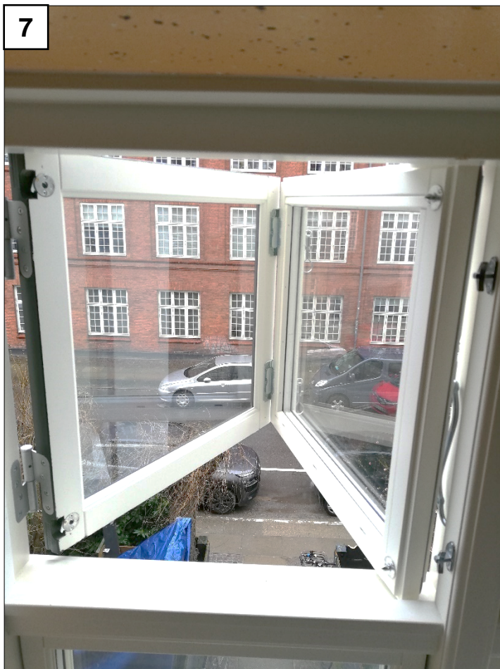
7: Efter at den koblede ramme er åbnet, kan vinduet nu puds