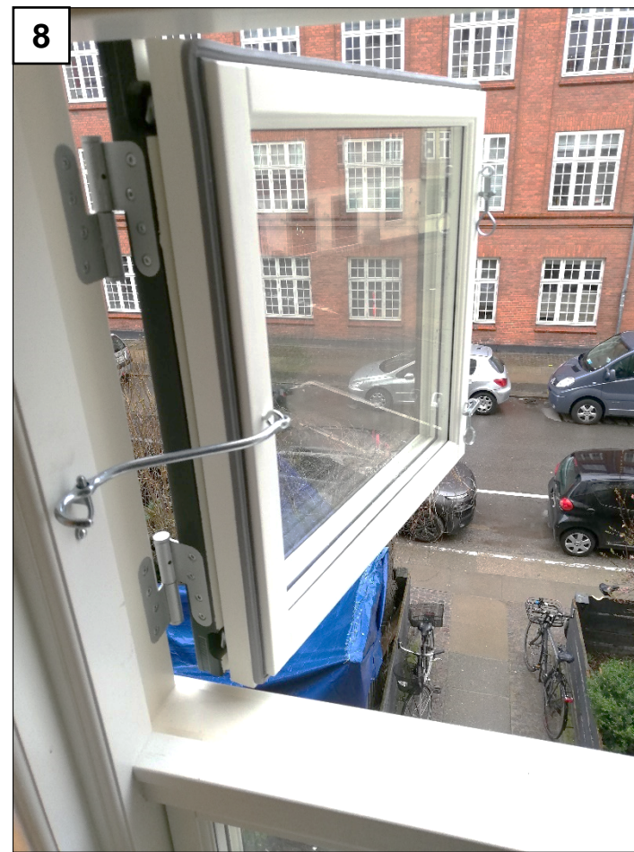
8: Vinduets position kan sikres således, via stormjernet