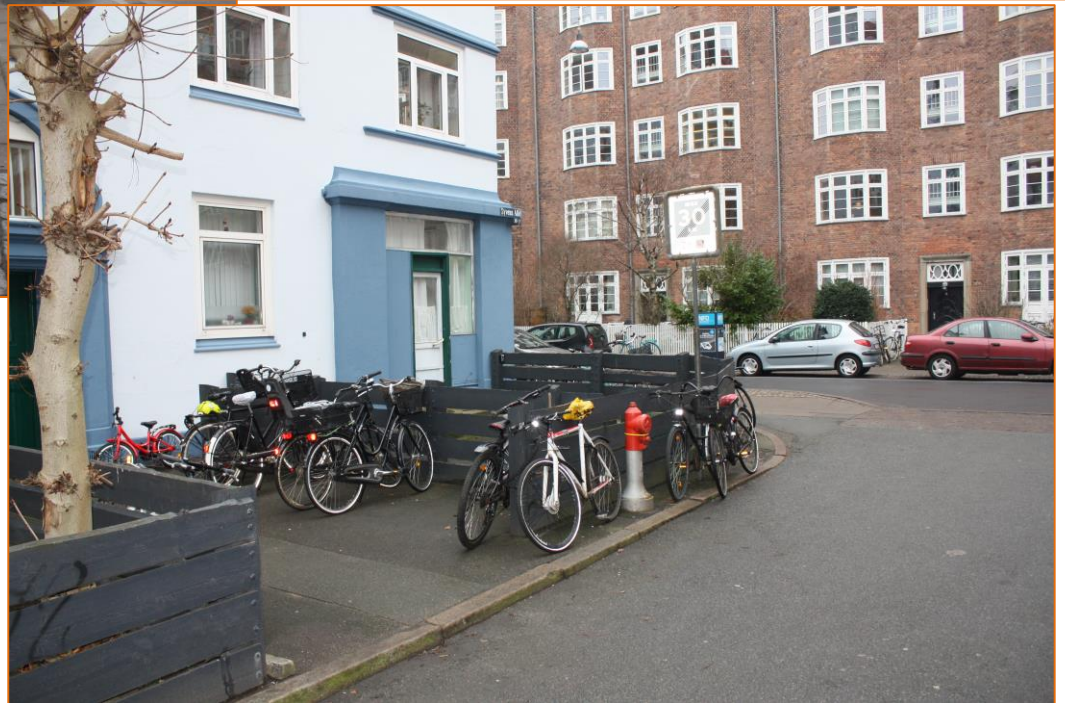
Syvens alle / Hollænderdybet