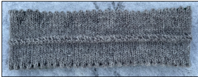
Innsiden av pannebåndet, sydd sammen