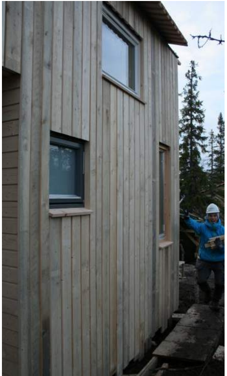
Bygghytten begynner å ta form!