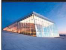
Den Norske Opera