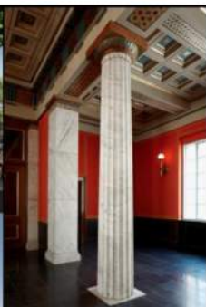
Domus Media