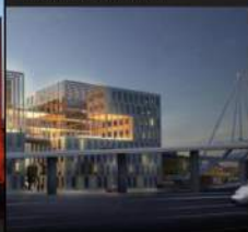
Schweigaardsgate 21 og 23