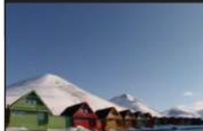
Longyear Energiverk