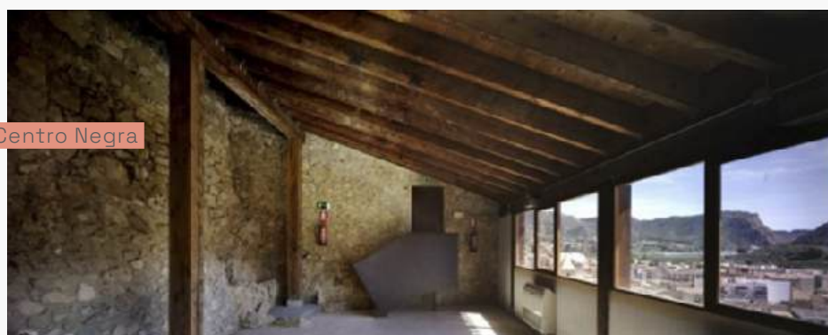
Studio in Centro Negra

Su arquitectura recupera antiguos corrales para animales y pequeñas viviendas de comienzos del siglo XX. Conserva paredes de piedra originales y salientes de montaña. Actualmente, el edificio está conformado por 6 espacios diferentes e interconectados. Cada uno de ellos es único en cuanto a su escala y morfología.