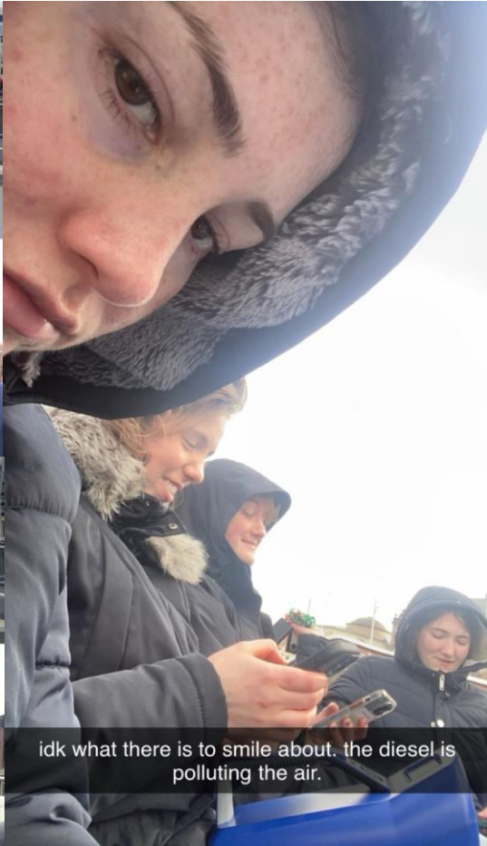
idk what there is to smile about. the diesel is polluting the air.